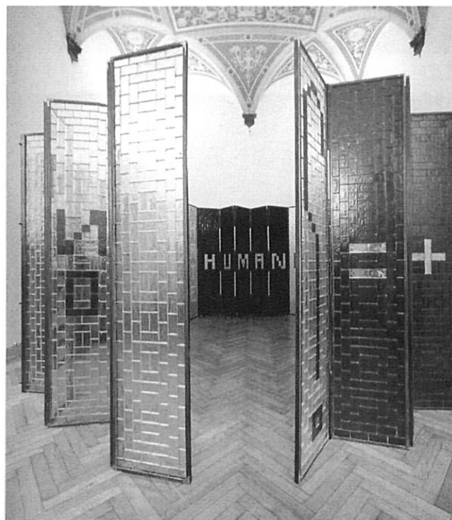
Jaume Plensa, Sogni in bianco e nero? , exposició juliol/setembre 2005.

Quan Salvador Sunyer va reactivar-lo el 1989 com a sala municipal consagrada a l'art contemporani, aquest local de la Rambla tenia ja al darrere una llarga trajectòria expositiva que era també el reflex dels avatars polítics dels últims seixanta anys,