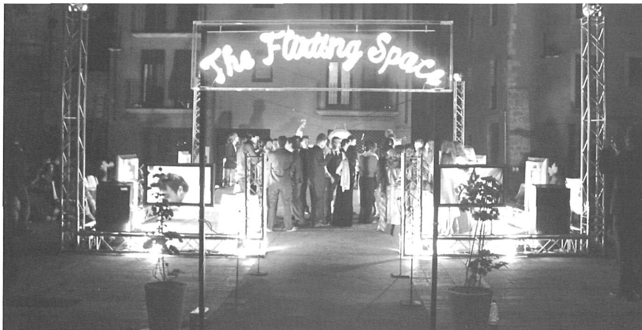
The Flirting Space, 2004.