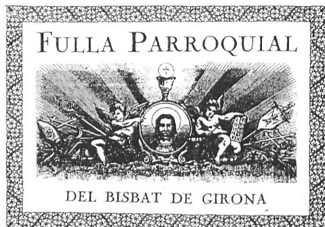
Capçalera del primer full parroquial de Girona d'àmbit diocesà.

El 27 de juny del 2004, el full parroquial de Girona va publicar el número 4.000. Com a Full Parroquial diocesà de Girona entenem avui la publicació de la qual el Bisbat de Girona -com a institució-, n'és la responsable, tant pels continguts com pel seu finançament. Té un caràcter formatiu i informatiu de la vida eclesial i de l'activitat pastoral.