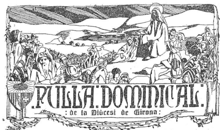
Capçalera del primer full parroquial editat pel Bisbat de Girona.