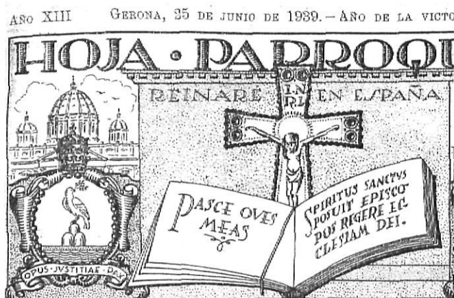
Capçalera del primer full parroquial després de la Guerra Civil espanyola.

El 27 de juny del 2004, el full parroquial de Girona va publicar el número 4.000. Com a Full Parroquial diocesà de Girona entenem avui la publicació de la qual el Bisbat de Girona -com a institució-, n'és la responsable, tant pels continguts com pel seu finançament. Té un caràcter formatiu i informatiu de la vida eclesial i de l'activitat pastoral.