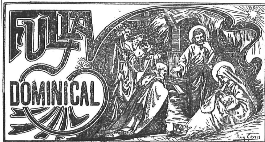
Capçalera del full dominical editat a Vic.

gust de casa. Per altra banda, la diòcesi, té possibilitats per a sortir-se'n bé».