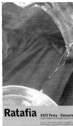
La vint-i-desena edició es va celebrar del 6 al 9 de novembre del 2003.

nista central de la tardor a la capital de la Selva. Amb les deliberacions ajustadíssimes i sàvies del jurat –sembla ser que ha estat difícil decantar-se per una de les set darreres finalistes–, Pepita