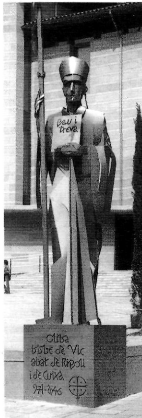
L'Abat Oliba, a l'entrada del Museu Episcopal de Vic.

Una circumstància present en aquesta exposició, i que sempre caracteritza l'obra de Fita, és l'ús de suports i materials industrials, sovint procedents del rebuig, i gairebé sempre descontextualitzats o allunyats del seu ús primigeni; en aquesta exposició són els plotters informàtics i els plàstics i la tinta xinesa o llençols. En definitiva, el Fita polièdric, el de la mirada escrutadora, la curiositat il·limitada, l'artista que combina el seu ferri aprenentatge acadèmic amb la provatura atzarosa o la barreja de materials a priori impossibles. En