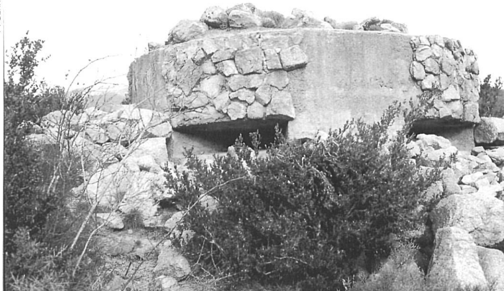
Vestigis actuals de la línia P.