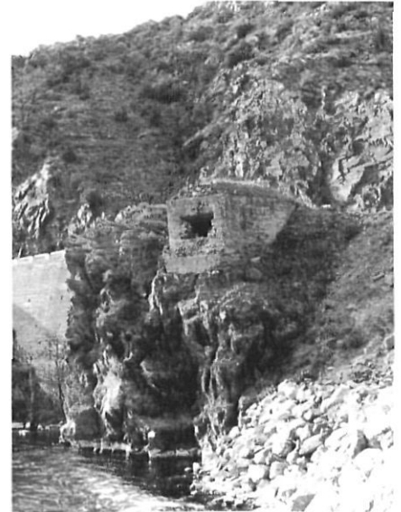
Un dels fortins oblidats.

I afegia que els enginyers guanyaven una pesseta diària mentre que hom donava 25 cèntims als altres soldats i que tenien cada matí un got de vi i un entrepà.