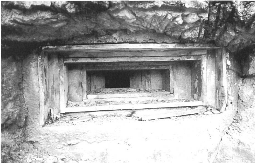
Hi ha moltes peces de fusta enmig del formigó.