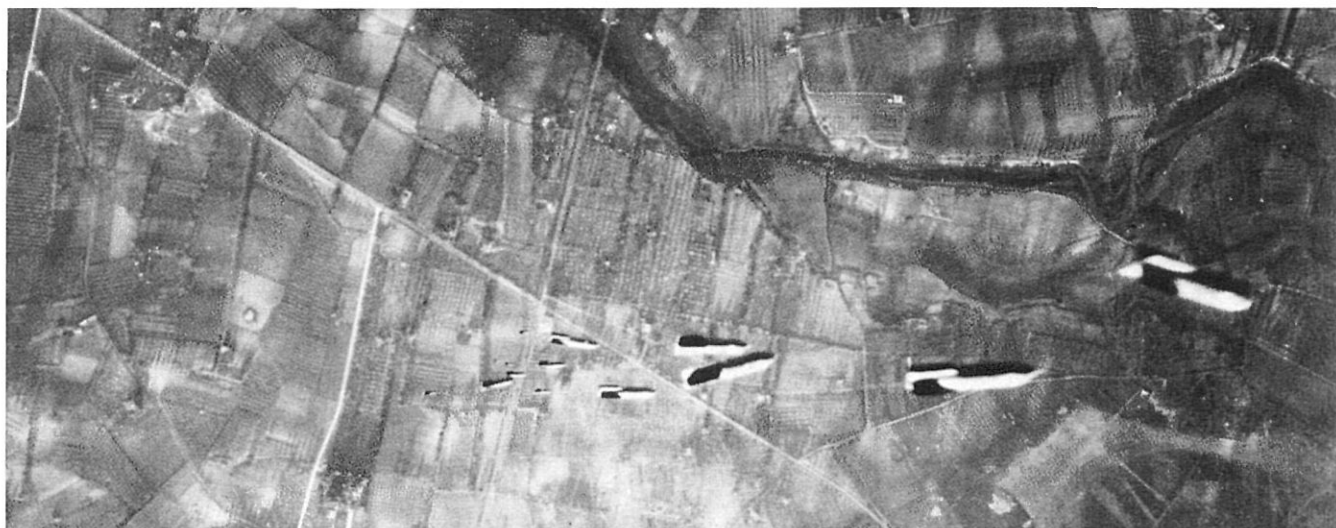
Fotografia aèria d'un bombardeig a Catalunya, el 5 de novembre de 1938.

«Es hermano de un joven al que el bombardeo que sufrió esta población ha sorprendido en el trozo de carretera que desde dicho Caserío de Ventajola conduce a éste de Puigcerdà guiando una tartana y que una de las bombas lanzadas cayó cerca de donde se encontraba, matándole así como a la yegua uncida a la tartana».