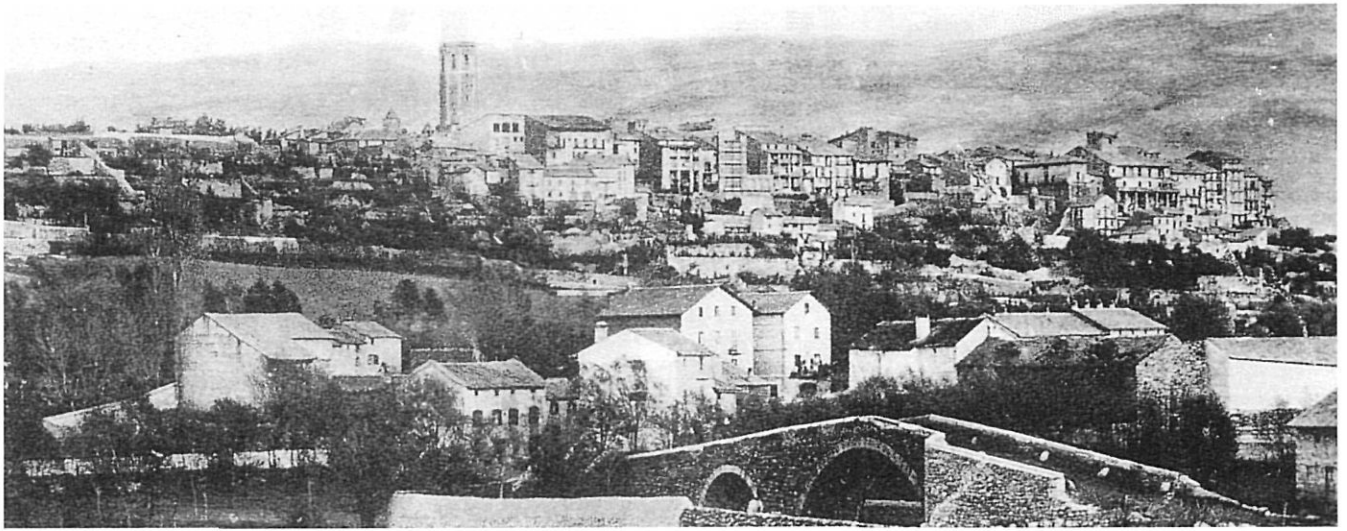
Vista general de Puigcerdà.

l'horitzó, hom va sentir dues tímides salves dels canons francesos de Naüja» (4).