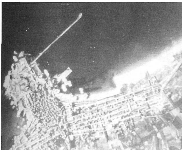
Bombardeig de Palamós, el 13 de setembre de 1938.