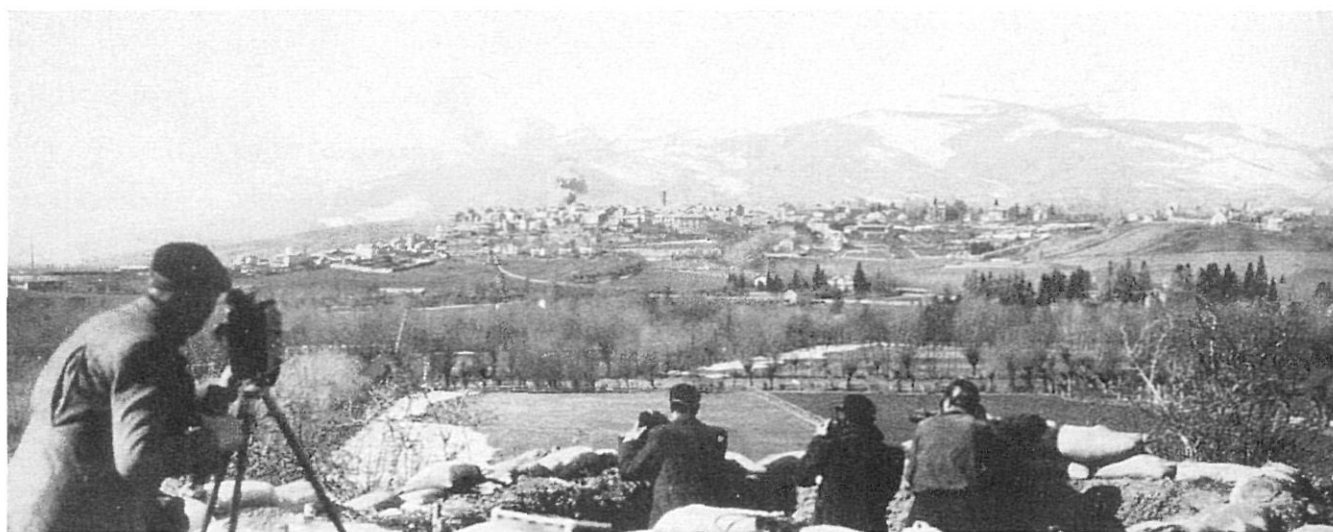
Els fotògrafs contemplen la columna de fum que s'aixeca de Puigcerdà.

Cinc minuts després de migdia, l'esquadrilla va tornar a passar, sempre a la mateixa altitud, damunt de Puigcerdà. En la vall van bombardejar intensament l'aeròdrom d'Alp, on, diuen, hi havia dipòsits d'avions. Però com mai hom va veure volar-ne en aquests paratges, hom dubta generalment de la seva existència. Sigui el que sigui, els vuit aparells van tornar a prendre la direcció de Ripoll. El seu raid era acabat».