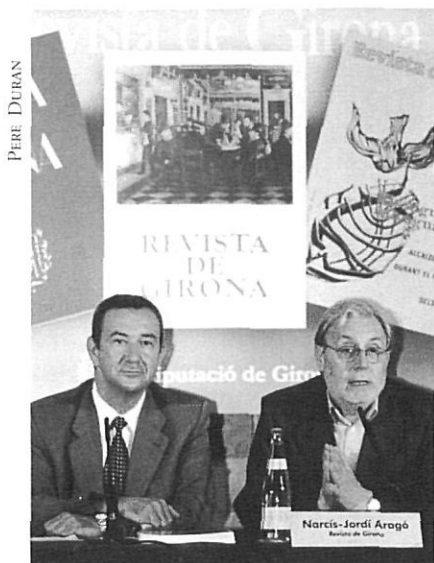
El president de la Diputació amb el director de la «Revista».

dels subscriptors i lectors, en els quals rau la veritable raó de ser de la revista.