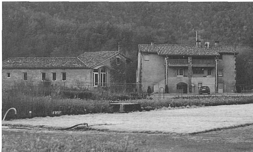
La cooperativa La Fageda, de Santa Pau, l'any 1999.

tañà a l'ombra de Caritas (la relació dura fins a l'any 1971). En aquesta època, en què no hi ha encara la moderna Seguretat Social, desenvolupa una tasca social ben meritòria en la cobertura dels riscos (malaltia, jubilació, etc.) de les persones que treballen de minyones.