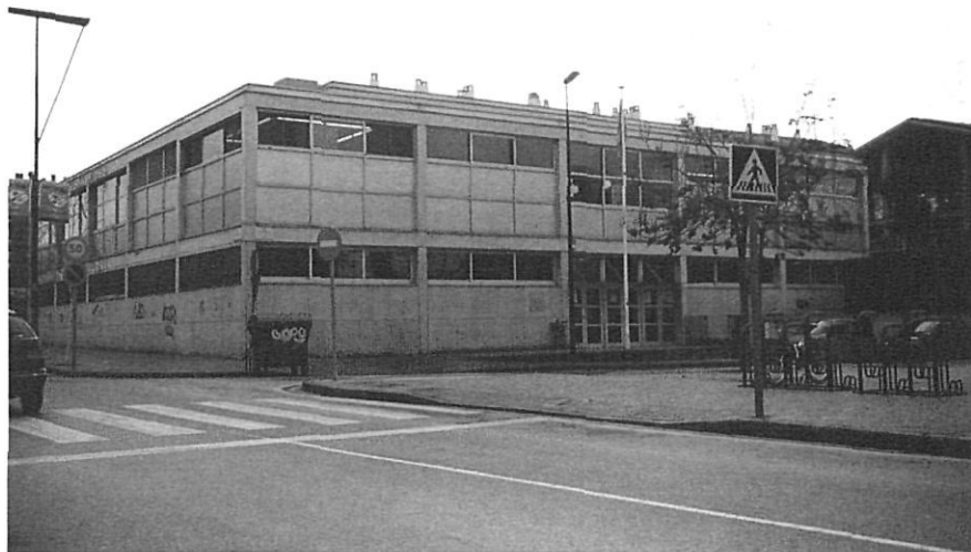
El Casal i Centre de Dia Onyar, de Girona, l'any 2000.

En el camp de la immigració, són diverses les entitats gironines que han actuat a favor d'aquests col·lectius: SER.GI, GRAMC, la Fundació de Caritas, i moltes altres d'àmbit local.