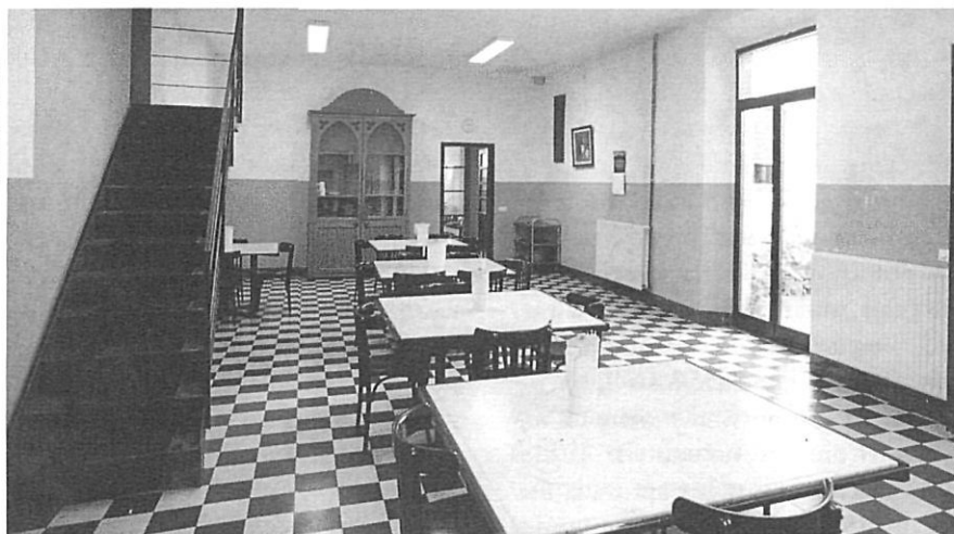
El menjador de La Sopa, de Girona, l'any 2000.

També ens hem de referir a la Delegació del Montepío de la Divina Pastora del Servei Domèstic, creada (1957) per iniciativa del bisbe Car-