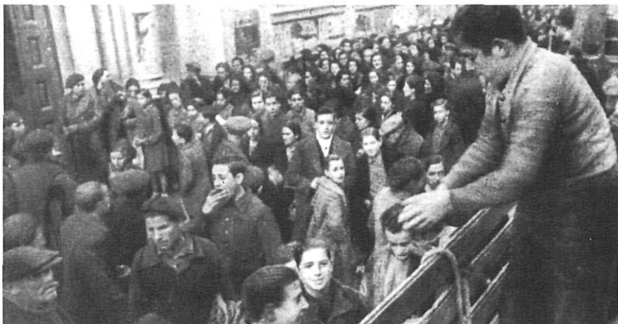
Distribució d'aliments d'Auxilio Social a Girona, el febrer de 1939.

Un altre aspecte que hem de conèixer són les ajudes destinades a la vellesa des de l'Ajuntament de Girona. Es concedeixen pensions d'acord amb els pressupostos disponibles, per això, quan un beneficiari mor s'atorga al més vell que figura a la llista si reuneix les següents condicions: pobresa i residència mínima de 5 anys a Girona; tenen preferència els de més de 80 anys i que són fills de Girona. Els beneficiaris reben 1 pesseta diària. També es té en compte si tenen família, fills o parents, que els poden ajudar (segons documents de 1922). Altres documents administratius de l'època ens mostren que les pensions a la vellesa només són percebudes per una minoria pobra i de 80 anys en amunt.