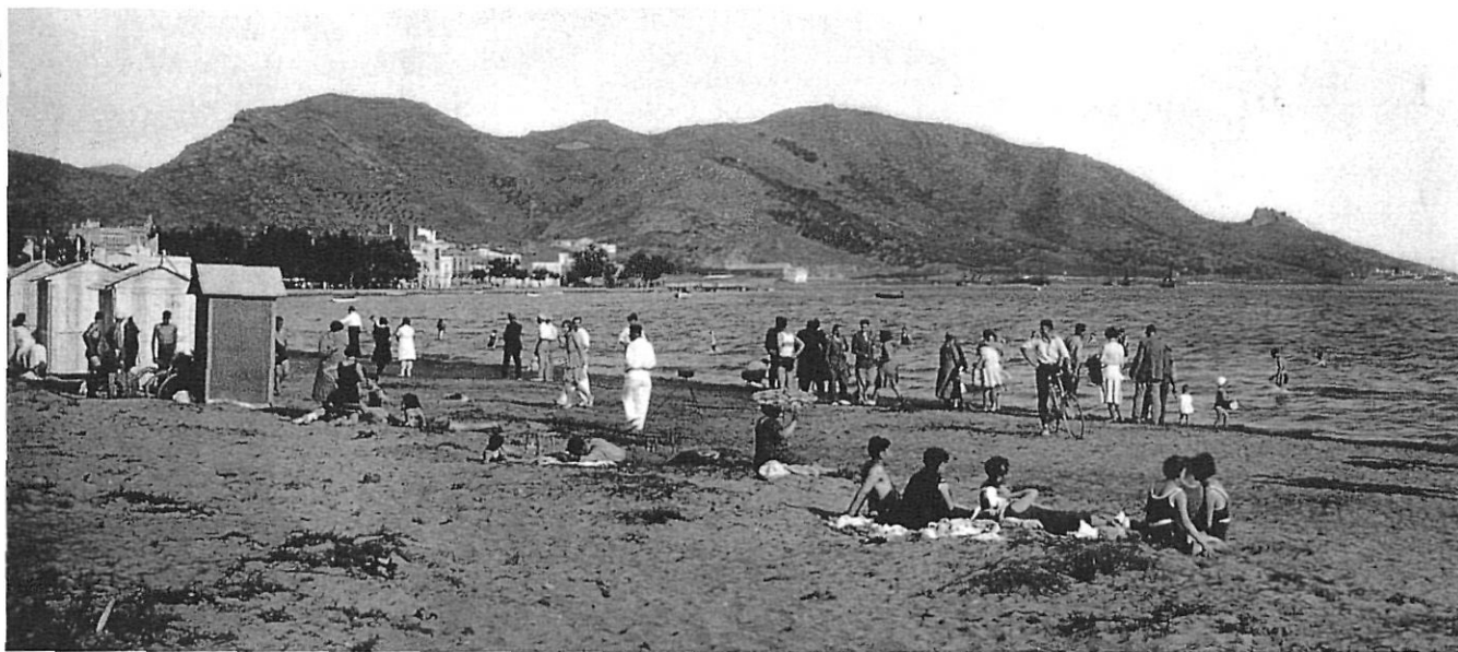
La platja de Roses, a començament de segle.