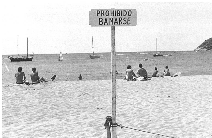
La platja de Castell, els anys 70.