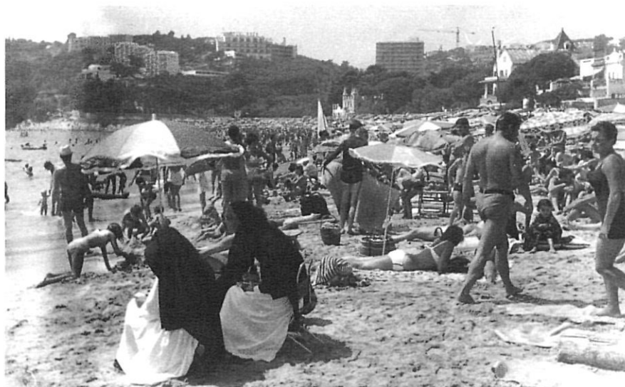
La platja de Sant Pol, de Sant Feliu de Guixols, els anys 60.

que es diferencia clarament de l'anterior i que, a la vegada, es subdivideix en dues etapes. La primera, el fordisme artesanal, es distingeix per la improvisació i la provisionalitat de l'oferta, amb una minsa participació del capital estranger. En la segona etapa, el fordisme industrial, s'entra clarament en l'estructura capitalista internacional, a la vegada que s'agreugen totes les contradiccions que el model ha anat generant.