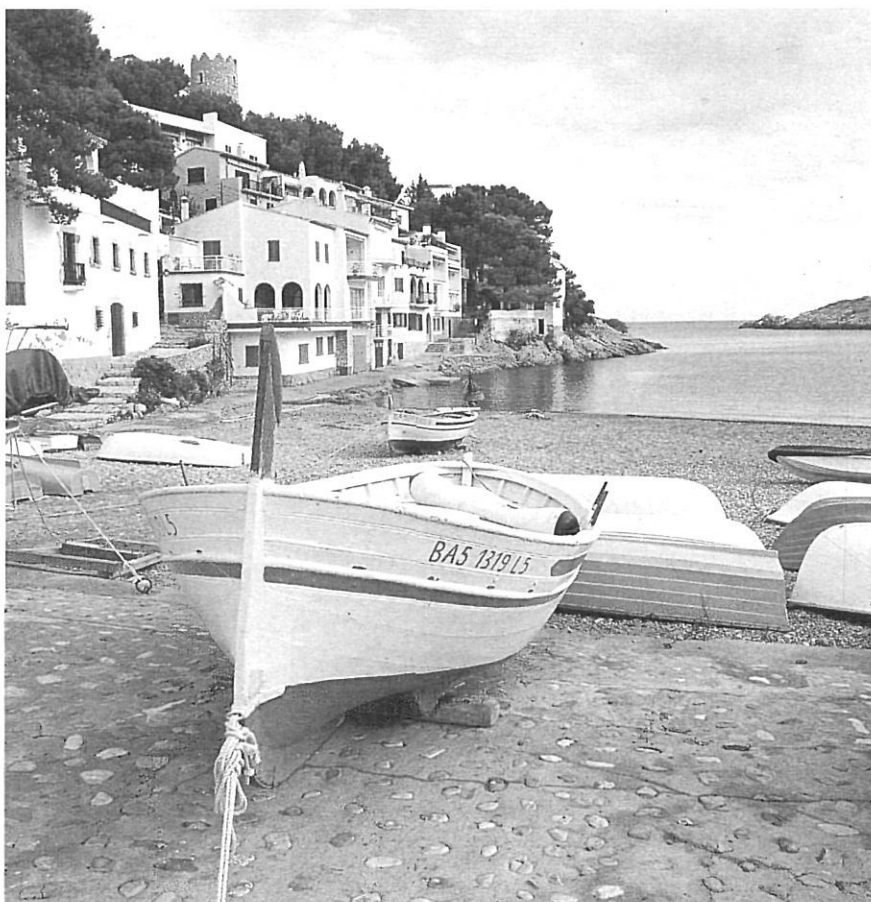
Sa Tuna, del municipi de Begur.

haver-hi alteracions municipals a les terres gironines; en aquest cas es tractà sempre de segregacions, tret d'una única agregació.