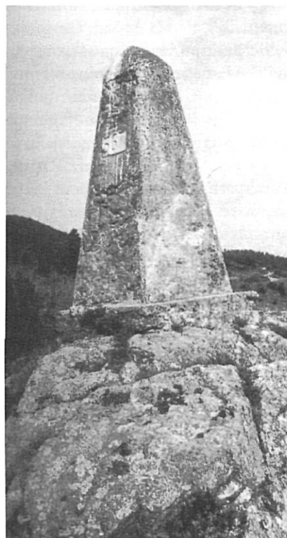
La Fita 567 presideix les restes arqueològiques de Panissars.

Moltes vegades el traçat del mapa municipal heretat és problemàtic en si, però certament algunes d'aquestes delimitacions polèmiques ho són des de temps ancestrals i només s'han