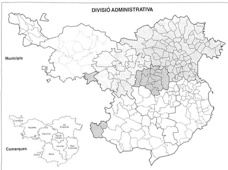
Divisió administrativa de les comarques gironines.

El Reglament de Població i Demarcació Territorial del 1952 suposà un incentiu a la fusió de municipis en les grans aglomeracions urbanes espanyoles, i malgrat que només feia referència explícita al cas de Madrid, Girona l'aprofità per iniciar un procés annexionista que inicialment afectà els municipis més directament implicats en la conurbació de la capital. Gràcies als 6,00 km 2 de Paluasacosta, als 14,67 km 2 de Sant Daniel i als 1,25 km 2 de Santa Eugènia, els