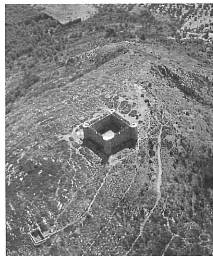
El castell del Montgrí, entre l'Alt i el Baix Empordà.

En alguns nuclis i pobles es viu l'interès per una possible independència municipal, amb argumentacions que apunten sobretot a l'existència de realitats espacials diferenciades o a problemes en el proveïment de serveis. Malgrat que en poques ocasions aquest interès es transforma en una iniciativa de segregació, aquest fet demostra tant les dificultats en l'administració per part de molts municipis com l'escàs pes concedit a la figura de les entitats municipals descentralitzades (només Arànsers a Lles de Cerdanya, Pi a Bellver de Cerdanya i Vil·lec i Estana a Montellà i Martinet), que,