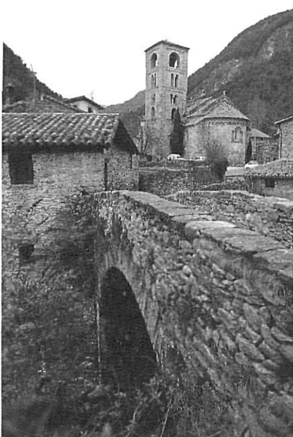
Beget, del municipi de Camprodon.

A la dècada dels 60 s'encetà un nou procés de reagrupament municipal, que, talment com havia succeït al segle XIX, afectà principalment la zona pirinenca, i reflectí altra vegada els processos de despoblament i canvi radical en la localització de l'activitat econòmica del país. Superada aquesta etapa, no fou fins al 1983 que tornà a