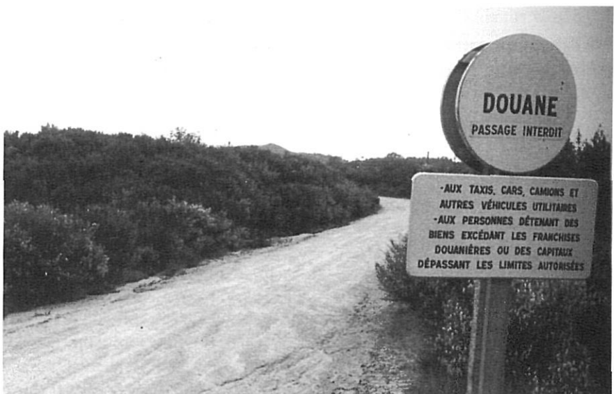
El camí de Tapis a Costoja, els anys 80.

D'ençà de la integració d'Espanya a la CEE i, sobretot, des de la teòrica desaparició de les fronteres interiors de la UE, alguns municipis situats a ambdós costats del límit francoespanyol han establert acords d'agermanament i de col·laboració en temes culturals o de promoció turística. Tanmateix, les iniciatives de crear un «municipi transnacional» (fusió de Cervera de la Marenda i Portbou) o la «comarca transfronterera» de Cap de Creus - Cap de Sant Vicenç s'han vist molt entrebancades pels Estats i pels tècnics de la UE.