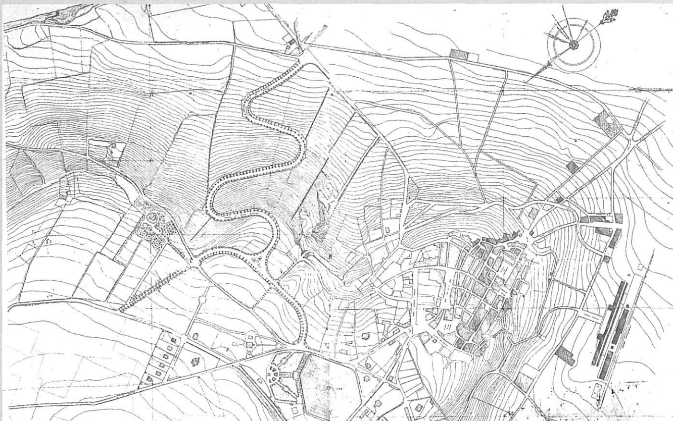
Plànol general de Puigcerdà, l'any 1925.