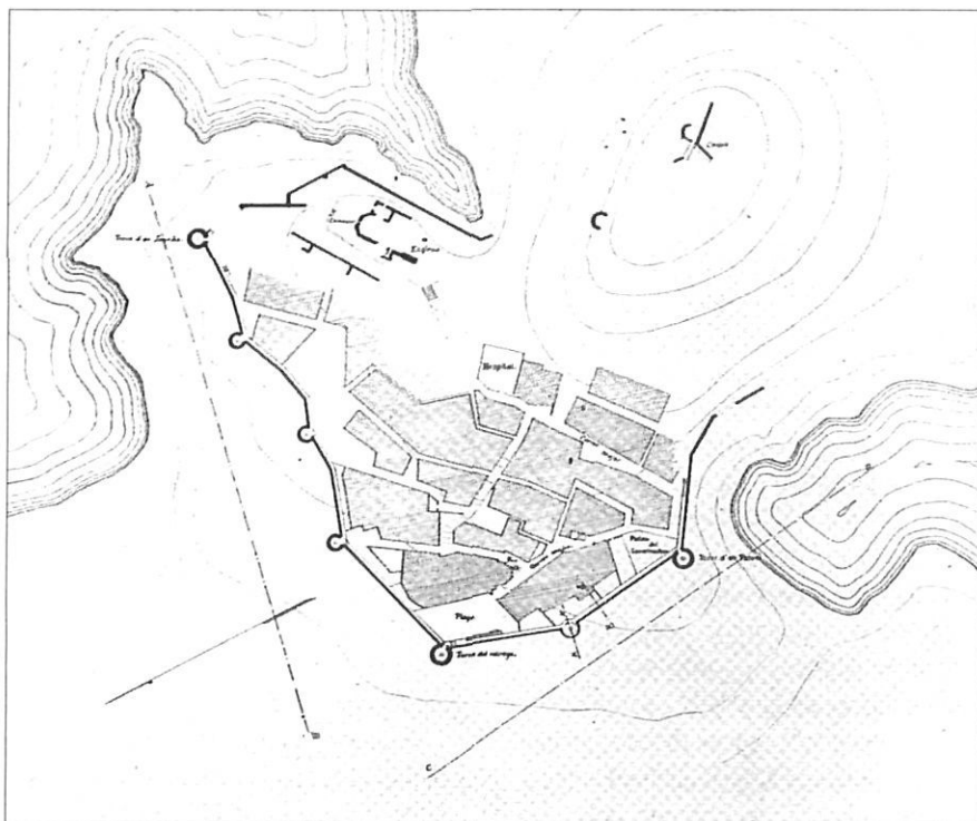
Planta del recinte de la Vila Vella de Tossa, en un plànol de c. 1930.

Malgrat les dificultats imposades, l'interès per la problemàtica i les delimitacions comarcals va continuar ben viu d'ençà del 1939, ja fos en forma d'estudis sobre les realitats comarcals o bé de debats a partir de la vigència de la divisió administrativa proposada per la Ponència. En el cas de l'àrea de Banyoles, la reivindicació d'una comarca pròpia es reactivà als anys 70: articles, estudis i manifestos van posar en evidència, si no de manera unànime sí de forma majoritària, el consens popular sobre els límits, el nom i, sobretot, la vigència