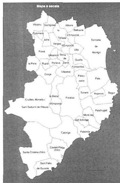
Mapa dels municipis del Baix Empordà.

La perspectiva històrica ha ben demostrat com en moltes ocasions aquests processos malmeteren el caràcter i la consciència específica de pobles, municipis, valls, i fins la coherència comarcal. A la Cerdanya bona part de les agregacions es van fer amb criteris de funcionalitat equivocats, o si més no arbitraris: municipis veïns podien ser imposadament fusionats només pel fet de ser-ho, sense contemplar les possibles afinitats de les respectives fonts de recursos econòmics, l'orografia i les característiques de l'accessibilitat interna, les tradicions i les relacions humanes, etc.; així es van formar artificioses i fins clarament absurdes