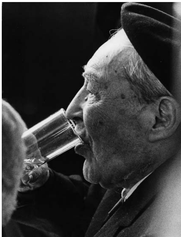
Josep Pla (1897-1981).

Tot plegat, els motius que originen la polèmica poden resumir-se d'aquesta manera: l'any 1869, Nietzsche visita Wagner, a Tribstchen, i el músic el convida a escriure un llibre que esdevingui el recolzament teòric de la seva música. Aquest llibre és El naixement de la tragèdia , publicat l'any 1872. Ara bé, quatre anys més tard, el filòsof assisteix, a Bayreuth, a la inauguració dels festi-