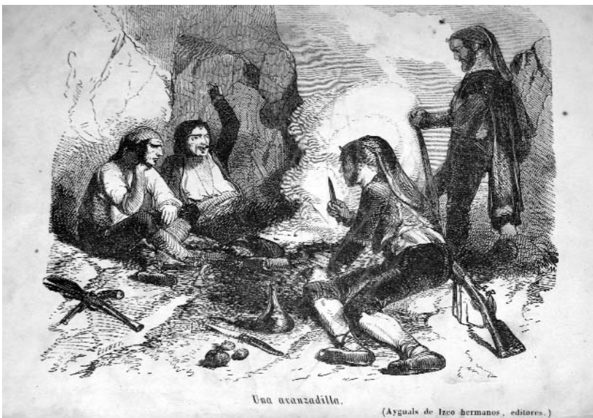
Colla de bandolers.

Besalú (com també se'l coneixia) la podem trobar a Verdadera relación del más bárbaro catalán José Pujol (alias Boquica) ,(7) un poema escrit poc després de la mort del miquelet caragirat, el 1815, on s'esmenta: «A Blanes cierta vez fueron / y sin causa ni razon / un barco nuevo quemaron / por capricho ó diversion». En el llibre d'òbits de la parròquia de Blanes del període que ens ocupa trobem aquesta nota datada de l'agost de 1810: «En la tarde de est dia de agost del any mil vuit cents y deu se topáren en esta vila las dos briballas española, y francesa, fentse foch la una contra la altre, pero com aquesta fou sorpresa per la primera, de ella sen trobaren tres de morts lo un en la Massaneda prop la Antiga, lo altre en la riera davant de la Creu, y lo ultim ala pujada de Santa Barbara cerca la jueria dita vulgarment den Gallina, y fetas las diligencias per averiguar los noms dels difunts vai averiguar que son los tres següents».(8)