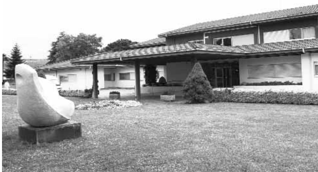
Parc Hospitalari. Edifici Els Til·lers.

càrrec –com de gairebé tota l'assistència psiquiàtrica i geriàtrica–, la Diputació de Girona, sota el servei de beneficència.