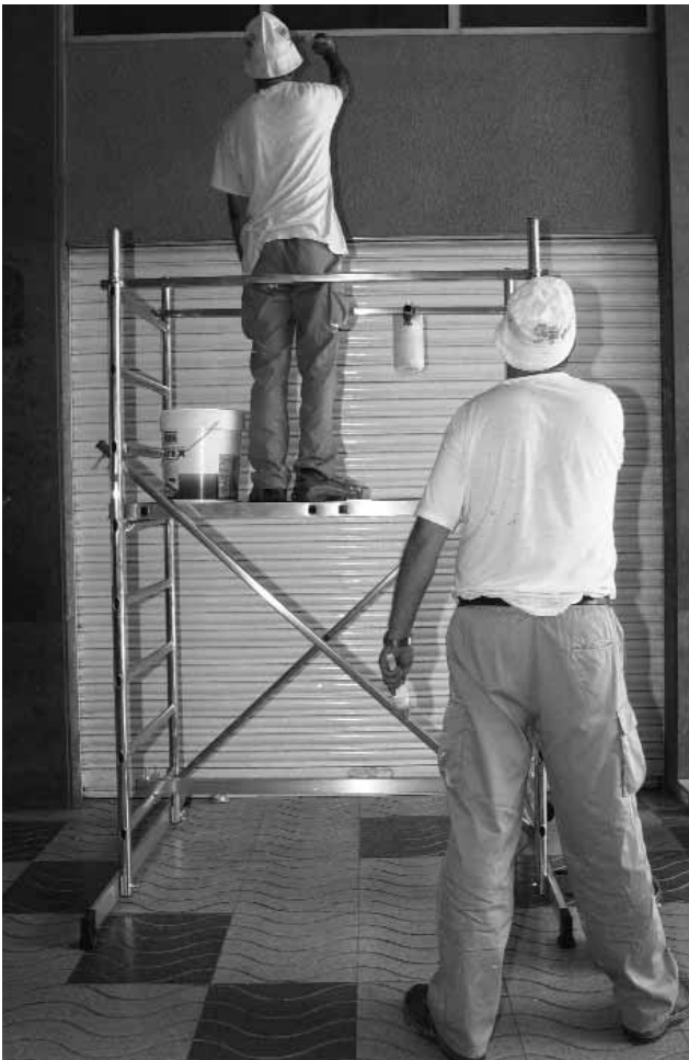
Feines de manteniment.

El paper que estan jugant entitats com l'Associació de Familiars de Malalts Mentals, l'Associació de Familiars de Malalts d'Alzheimer, etc. és molt rellevant quant a l'acompanyament terapèutic i el suport que ofereixen, a més de les reivindicacions que duen a terme per tal de millorar la situació de les persones amb malaltia mental i dels seus familiars.