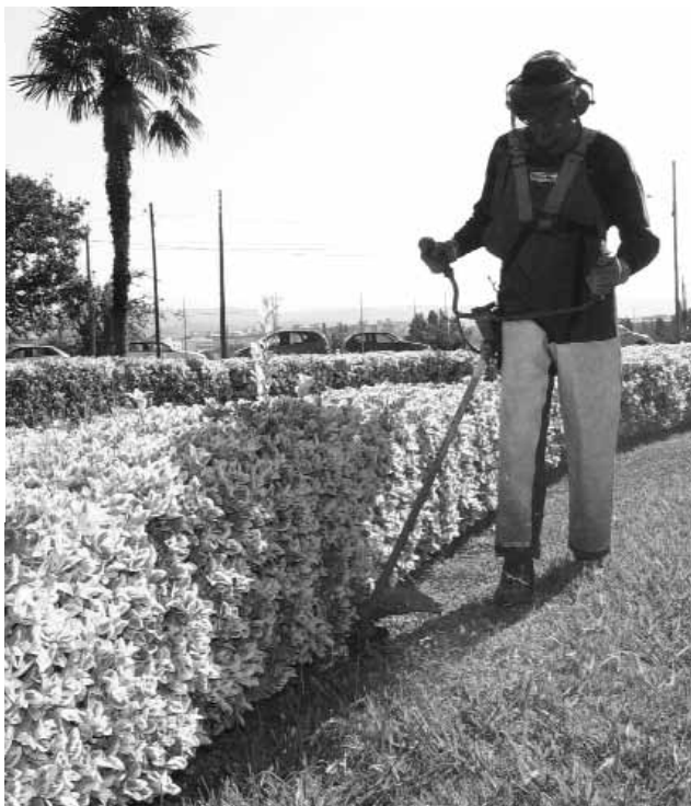
IAS de Girona.