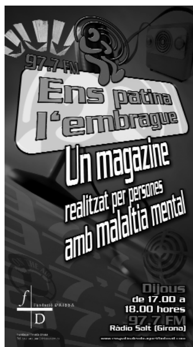
Cartell d'un programa de ràdio fet per malalts mentals.

A diferència d'altres províncies de Catalunya, l'atenció dels serveis de salut mental a Girona estarà a càrrec d'una única entitat de caràcter públic, l'Institut d'Assistència Sanitària (IAS). Fa uns vint anys, aproximadament, se'n feia