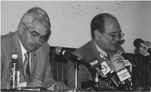
Amb Pasqual Maragall.

és considerada la més important del món de parla espanyola, tant pel volum de venda de llibres com pel nombre de visitants.