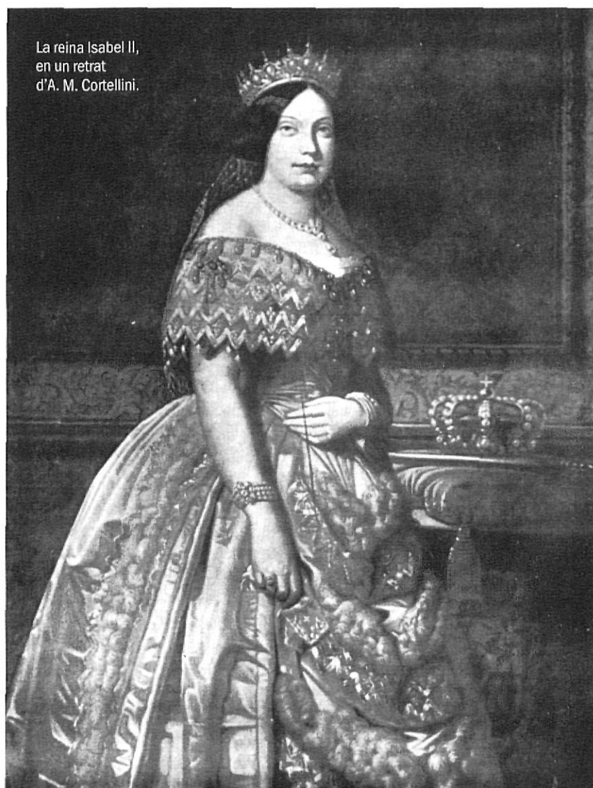
La reina Isabel II, en un retrat d'A. M. Cortellini.

El dia 29 de setembre de 1833 moria el rei d'Espanya Ferran VII, i seguidament començava el mogut regnat d'Isabel II. A un regnat conflictiu i alterat en seguia un altre d'alterat i conflictiu. Una reina de tres anys. Una regent inexperta. Un Consell minat per les divergències i la disparitat d'interessos. Un pretendent a la corona disposat a un sagnant enfrontament. Un país depauperat i arruïnats. Una societat escindida en bandositats i predisposada a encendre una guerra civil. Però es tractava de celebrar solemnement la coronació i de proclamar protocol·làriament la nova reina en tots els territoris que s'integraven en la corona. El manual d'acords del consistori gironí permet conèixer, amb tot detall, els actes de proclamació celebrats a la ciutat.