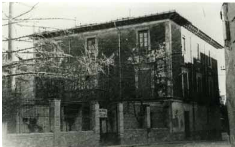
Fotografia 1. Casa de Gómez amb el pati, des del Portell de Granyana, llogada per l'Ajuntament d'Elx per a l'Institut Nacional de Segona Ensenyança.

Els primers exàmens d'ingrés per al curs 1931/32 se celebraren el 12 de febrer de 1932, a l'annex II es pot veure un examen d'aleshores. 32 El gràfic adjunt 33 mostra l'evolució de la matrícula de la prova d'accés a l'Institut de Segona Ensenyança d'Elx. Destaca el nombre d'inscrits per a l'ingrés en el curs 1932/33, tant sorprengué, que fou notícia destacada