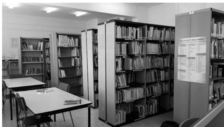
Fig. 2. Fons de lliure accés ordenat d'acord amb el criteri CDU.