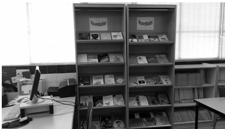
Fig. 1. Secció de novetats i informació bibliogràfica.

Al setembre de 1997 pel Decret 231/1997 es transformen els CEP en esdevenir CEFIRE (Centre de Formació, Innovació i Recursos Educatius) de la Comunitat Valenciana. La B-CD ix reforçada en aquest decret ja que entre les funcions dels CEFIRE hi ha la de «posar a disposició dels centres educatius i del professorat els fons documentals i bibliogràfics i els mitjans audiovisuals, així com tota la documentació i els materials que faciliten el desenvolupament curricular en els centres docents», el CEFIRE feia aquesta funció a través de la seua B-CD.