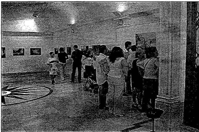
Aula de cultura de la CAM. Elx.

Quant a la fotografia, hem tingut la sort d'aconseguir que hi participen tres fotògrafs que porten molts anys mirant la comarca amb les seues càmeres: Andreu Castillejos, Francesc Cascales i Rubén Sempere, però que, al marge de la seua ja coneguda i acreditada trajectòria professional, han demostrat una sensibilitat i un coneixement del nostre entorn admirables. Tothom que ha tingut ocasió de veure l'exposició, ha pogut avaluar la qualitat del seu treball gràfic. No ha estat fàcil realitzar la selecció de fotografies, no solament per la quantitat manejada, unes dues mil, sinó també per la seua qualitat i mirada crítica.