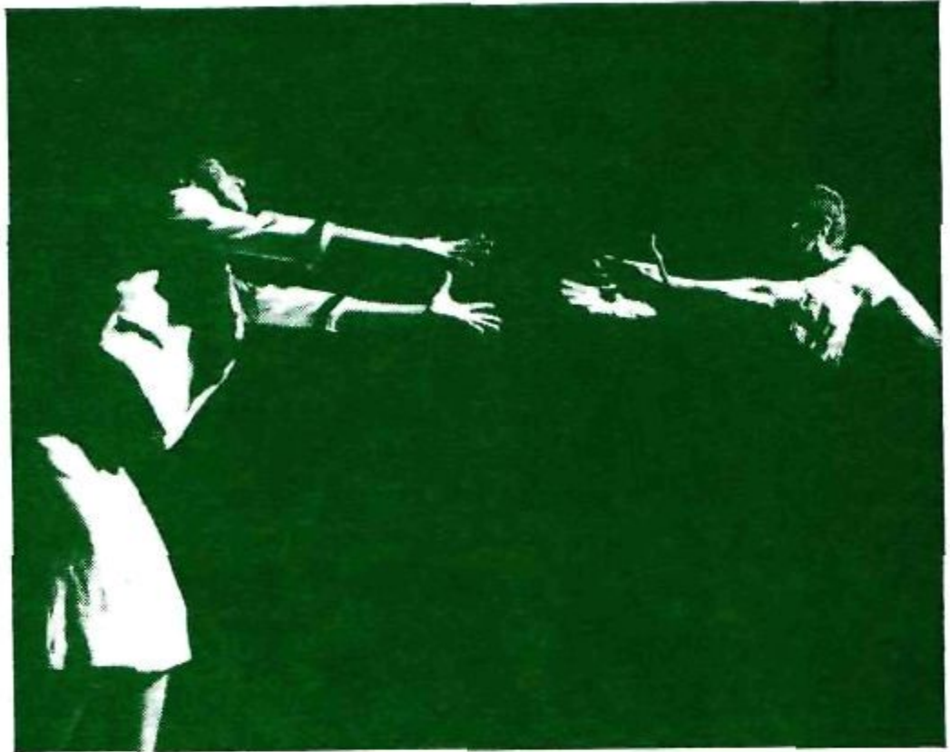
« Campo de los Almendros », creació col·lectiva de La Carátula, el darrer muntatge del grup (Foto: Carlos Morante. Elx, 26-8-83)

Carátula d'Elx o el grup d'Alacant Alba , que de sempre havien maldat per fer un teatre més o menys renovador i donaven anàlegs arguments, tot i que entre els sainets alcoians i el Misteri d'Elx hi ha certa diferència.