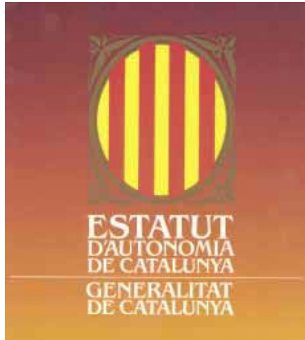
Portada de l'Estatut d'autonomia de Catalunya de 1979