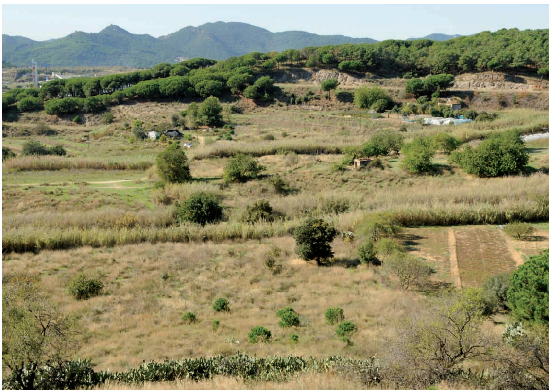
Figura 3. Espai obert antigament conreat i actualment en vies de colonització per la vegetació natural.

disminuït considerablement. Molts d'aquests espais han estat sotmesos a fortes tensions immobiliàries de caire especulatiu; i sinó, els camps han estat abandonats per fer explícita la necessitat de modificar els plans directors urbanístics municipals i així poder passar a ser espais urbanitzables programats. Concretament a la comarca del Maresme, la zona agrària periurbana s'ha vist substituïda en aquests darrers anys en benefici de l'expansió urbanística creixent, o bé per l'establiment de grans zones de serveis i de grans infraestructures, o també per polígons industrials poc consolidats (Sabater et al., 1997a). En canvi aquelles zones que quedaven un xic més allunyades de la ciutat, si l'activitat agrària no ha tingut continuïtat, aleshores aquests espais han esdevingut cada cop més naturalitzats (fig. 3). Durant els darrers 20 anys, molts d'aquests espais s'han mantingut relativament oberts sense la frondositat de la vegetació arbrada (Sabater et al., 1997b). Des d'un punt de vista ecosistèmic, aquests espais esdevenen transitoris i deixen que la successió natural de les espècies que colonitzen aquests indrets faci el seu curs cap a estadis més madurs formats per masses boscoses. Els ecòlegs anomenen aquests espais de transició espais de successió secundària pel fet que la colonització per part de les espècies que inicia tot aquest procés no comença de zero, sinó que la colonització s'inicia a partir de poblacions herbàcies ja