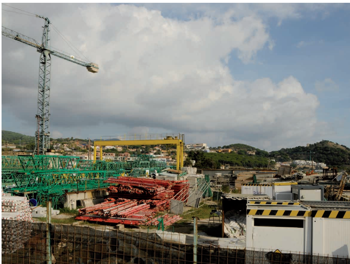
Figura 5. Activitats disconformes amb els usos agrícoles a l'espai agrari de les Cinc Sènies.

La singularitat de qualsevol paisatge agrari és la seva activitat; i sense ella el paisatge deixa de ser funcional i dinàmic. Un dels avantatges que té aquesta zona de les Cinc Sènies és la seva rendibilitat agrícola, si es compara amb altres espais rurals periurbans, com és el cas de les zones agrícoles de la comarca del Vallès (Jornet, 2006). Per tant, cal potenciar i fomentar l'activitat agrària si volem seguir gaudint de paisatges oberts amb un cert interès naturalístic i ambiental. No té cap sentit si només tenim present la seva protecció, sinó que cal gestionar pro-activament el territori si no volem que es converteixi aquesta zona en una mena de