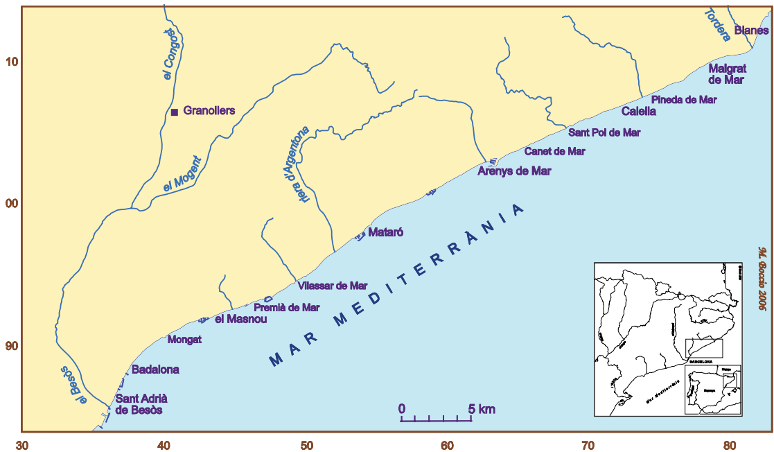
Figura 1. Mapa de situació del Maresme.

anuals entre els 600 i 700 mm, amb uns màxims a la tardor i a la primavera, però en general amb fortes irregularitats; els llevants poden portar precipitacions abundants, en especial durant la tardor. La temperatura mitjana anual se situa entorn dels 16°C a les terres properes a la costa. La marinada sol bufar amb regularitat, en especial els dies calmosos d'estiu, el que comporta una temperatura més suau a l'estiu. El caràcter marí condiciona en general uns hiverns temperats amb glaçades molt escasses, la qual cosa permet el conreu de plantes termòfiles amb collites primerenques, respecte a les del Vallès.