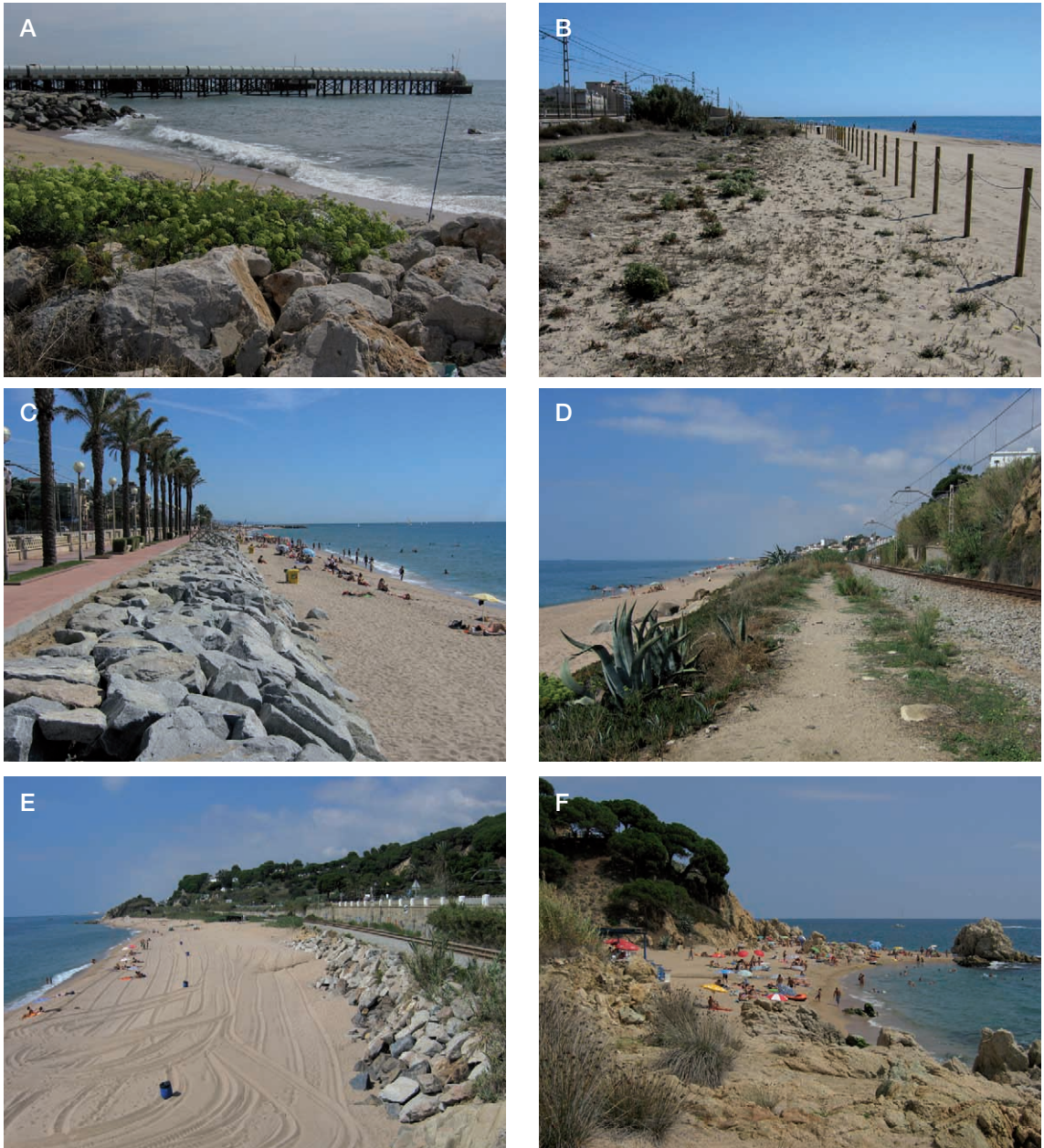
Figura 5. A, espai totalment antropitzat entre Sant Adrià i Badalona. Una mata de Crithmum maritimum creix enmig d'una escullera. B, petites i allargassades reserves a Vilassar on ben aviat s'ha vist la regeneració espontània, o afavorida, de diverses plantes característiques del litoral. La superfície reduïda d'aquestes reserves fa que calgui considerar-les com espais enjardinats. C, paisatge característic del litoral actual del Maresme. Se succeeixen linealment els paisatges següents: el mar, la platja, l'escullera, el passeig marítim, el ferrocarril, la carretera i l'àrea urbana. D, paisatges lineals quan encara resten indrets amb vegetació, malgrat que hi dominin les plantes ruderals. A Canet, a causa de la presència d'una costa alta, se succeeix el mar, la platja, una escullera estreta, una franja de vegetació ruderal, el ferrocarril i el penya-segat. E, marques de la neteja mecanitzada de la platja entre Canet i Sant Pol. Aquesta activitat impossibilita la permanència de qualsevol planta en els serrals litorals. F, penya-segats i caletes al sud de Calella, un dels indrets més bells de la costa del Maresme i amb una ocupació notable als estius. A l'esquerra s'observa mates de Juncus maritimus i al fons pinedes de pi pinyer.

és raríssima arreu i absent en moltes franges de la costa del Maresme. Molt probablement algun dels peus localitzats corresponen a plantacions (fig. 4).