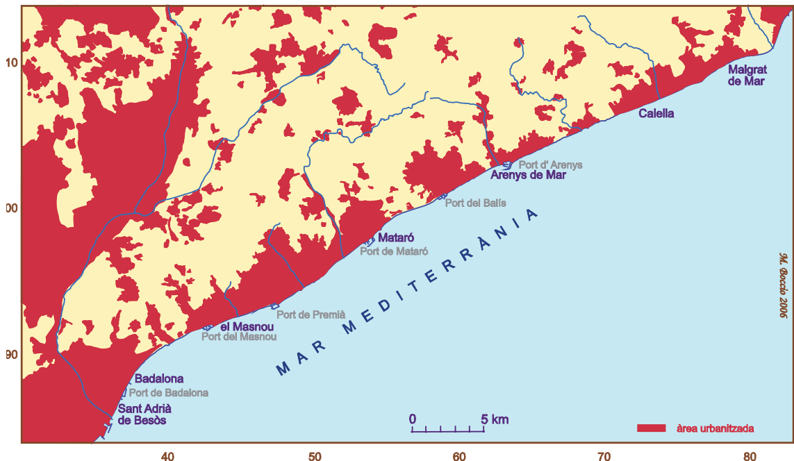
Figura 2. Mapa de l'espai urbanitzat i la localització dels ports esportius.

Tot plegat modificà el cicle de l'aigua i també les aportacions de sediments cap al mar. Però hi ha un fenomen que no s'ha pogut controlar del tot: han estat les riudes, les toraderades. Per a alguns són fenòmens catastròfics, i ho són perquè hi ha qui s'entossudeix