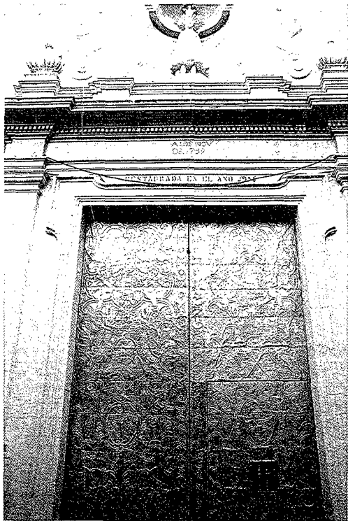
Capella del Santíssim Ecce-Homo, patró de Pego.

la propietat de la terra i la seua acumulació desigual. Sanchis Costa i Gil Pericás han trobat considerables diferències en la possessió de terres i s'han trobat persones que a penes arriben a la mitja fanecada al costat d'altres que s'acosten al miler. La petita propietat representa el 40 % del conjunt i només té el 5'5% del total de terres; els mitjans propietaris és el grup majoritari, el 53'4% amb el 51'5% de la superfície; la gran propietat, amb una variació entre 100 i 1.000 fanecades, és del 6'6% dels propietaris i tenen el 43%. Diferència que s'aguditzava amb la qualitat de la terra dels grans propietaris, considerades com de millor rendibilitat. 18