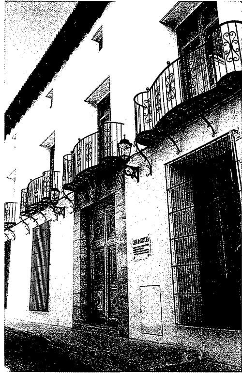
Antiga casa de la família Sala.

És tot un camí d'ascens el que recorren les classes benestants al llarg de la segona meitat del segle XVIII, afavorit per l'alça dels preus. A finals de segle la propietat de la terra s'acumularà en les seues mans en detriment dels camperols més desprotegits, afectats per la privatització, que els va llevar