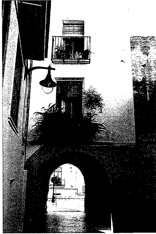
Porta de la muralla de l'antiga Vila.

Es tracta d'una agricultura sotmesa a les adversitats climatològiques i epidemiològiques. El 1756-1759, plaga de la llagosta, climatologia negativa i disminució del comerç per la guerra dels Set Anys; el 1763, pluges excessives; el 1771-1772, crisi de subproducció agrícola; el 1773, a la manca de blat s'associa la crisi del sector tèxtil seder, a la qual cosa s'uneixen les despeses ocasionades pel manteniment de l'aquartermament d'Alcàntara; el 1775, els danys produïts per l'aigua a les collites de seda, blat, panís, oli, raïm... costen 45.800 lliures; el 1780-1781, climatologia adversa i especulació desenfrenada, manca de blat i guerra amb Anglaterra. 11