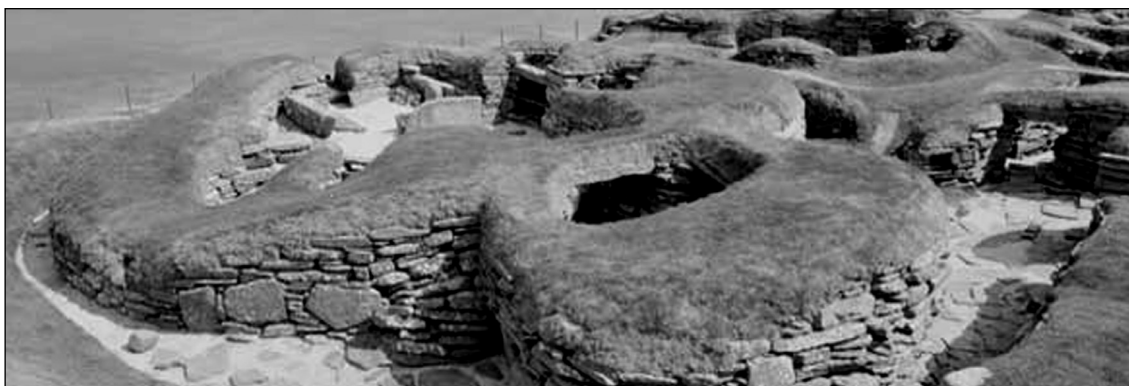
Jaciment neolític de Skara Brae a Orkney (Anglaterra) excavat per Gordon Childe.

meva ment de lleis transcendents que van determinar la història i de causes mecàniques, ja siguin econòmiques o mediambientals, que en pauten automàticament el curs». 44 La seva dependència d'un Marx més materialista-dialèctic constitueix l'ingredient principal de les seves últimes obres. En aquestes obres hi destaca la insistència en el fet que la teoria mai ha d'anar divorciada de la pràctica , que l' estructura de la realitat no transcendeix a la seva expressió històrica o que la funció del coneixement és pràctica i el seu objecte és guiar l'acció . 45 Quant a l'arqueologia, insisteix que la seva principal tasca és la interpretació econòmica, sociològica i, en darrera instància, històrica a partir de la informació que facilita, fet que en realçaria la posició i suposaria un avenç en la història humana. 46