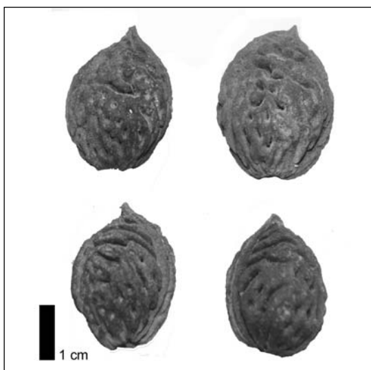
Figura 3. Conjunt de pinyols de préssec ( Prunus persica ) procedents de Iesso.

S'han recollit exemplars de nou en contextos de la fase republicana d'Ilerda (ALONSO, 2005), al dos pous de Iesso (BUXÓ [et al.], 2004), a les fases de l'Alt i el Baix Imperi de Vilauba (BUXÓ, 1999a), a la font del Peri 2 de Tarragona (BUXÓ, inèdit) i també en dues sepultures d'entre mitjan segle IV i el final del segle V dC de la villae de la Barquera (Perafort, Tarragona) (BUXÓ, 1997).