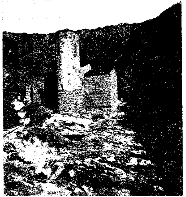
Fig. 3. Vista de l'església i del cementiri de Sant Vicenç d'Enclar.

El cas més estudiat és el de Sant Vicenç d'Enclar. S'hi han realitzat vuit campanyes d'excavacions arqueològiques. L'interès d'aquest nucli, pel que fa al tema dels poblats abandonats, és que aquest lloc ha estat ocupat en diverses ocasions. La darrera fou a finals del segle XIII, moment que s'abandonen nom-