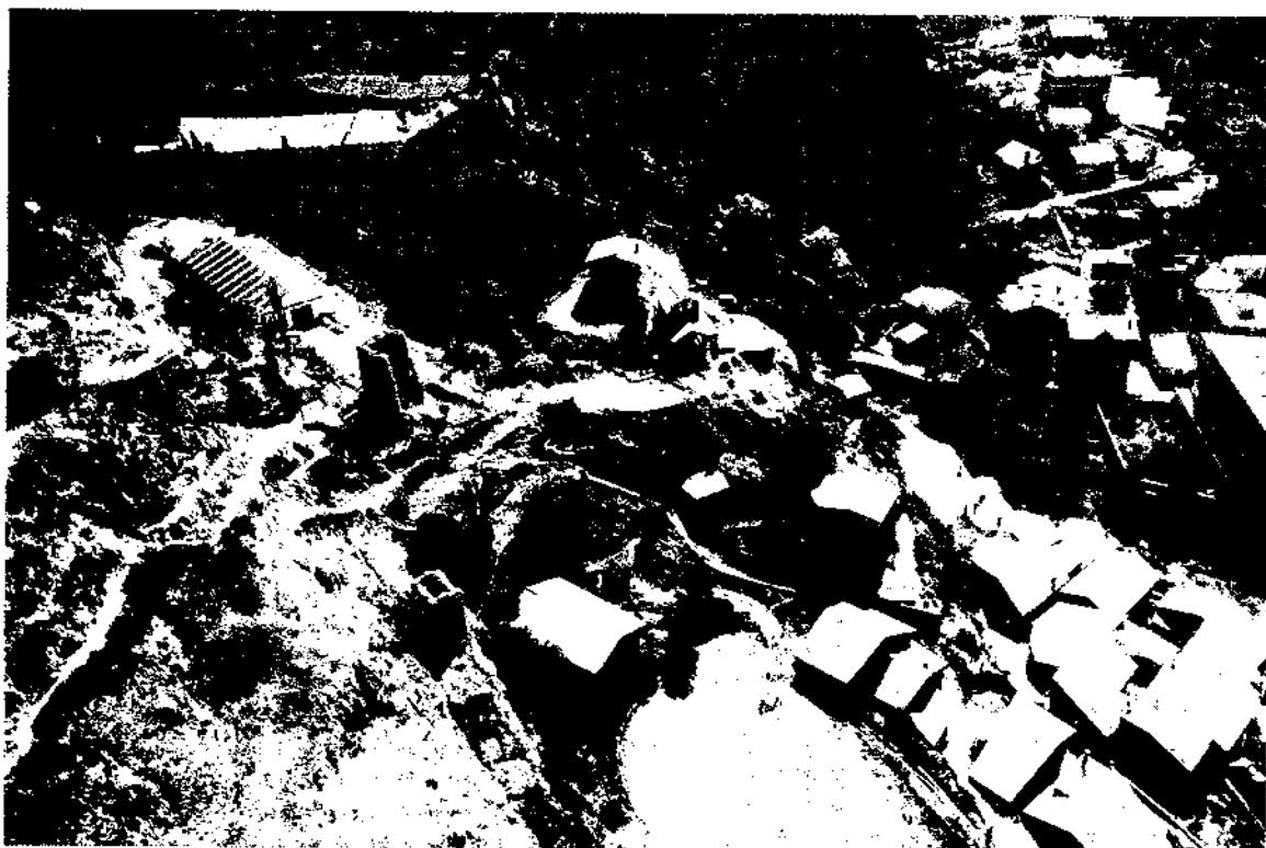
Fig. 1. Vista del Conjunt de les Bons. Pot observar-se que la part més alta, on hi ha les restes de diverses construccions medievals i l'església, és la zona que probablement quedà deshabitada a partir del segle XVI o XVII.

D'altra banda, a Andorra s'han realitzat poques prospeccions per poder estudiar aquest tema. En els