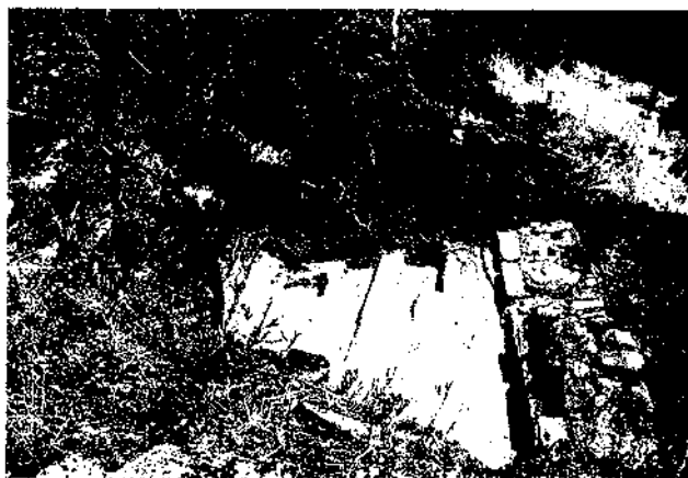
Fig. 2. Restes del dipòsit d'aigua de les Bons.

tidiana a l'Edat Mitjana a Andorra provenen d'aquestes excavacions. Respecte a Les Bons, només s'ha excavat una torre de defensa, probablement lligada a un altre edifici format per una casa forta, part de les canalitzacions, accessos i dipòsits. A més a més, es coneix algun recinte que podria ser algun lloc d'hàbitat, i se suposa també que a sota d'alguns dels edificis de l'actual poble de Les Bons, es podrien trobar més restes.