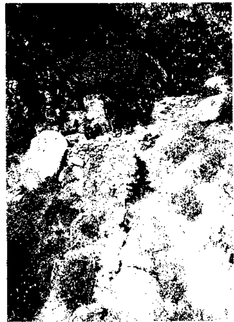
Fig. 4. Perspectiva dels sectors M1, T1 i H4 de Sant Vicenç. Aquesta zona es potencià bàsicament des de finals del segle XII a finals del XIII. A partir de 1288, s'abandona el poblat.

La mateixa situació física del poblat de Sant Vicenç d'Enclar ja ens fa pensar d'entrada en el caràcter estratègic més que no pas econòmic. Malgrat que durant tota l'Edat Mitjana tingué categoria de « castrum », no sempre fou aquesta la seva missió princi-