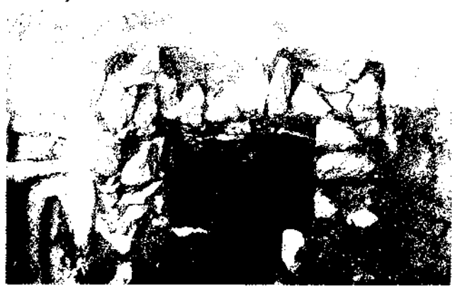
Fig. 6. Cup per a la fermentació del vi. Es tracta també d'una de les estructures de la zona bàsicament utilitzada entre els segles X i XI.

1190), però sí que podem dir que és el moment que la vida es desenvolupa a l'entorn de l'església (sectors C1, C2, H3, \alpha - \beta i \sigma i \tau ). Són construccions molt senzilles fetes de fusta, parets de pedra seca per ter-