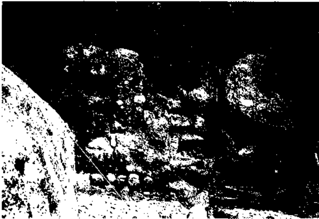
Fig. 5. Vista des del campanar, del sector A i B de Sant Vicenç. Aquesta zona es potència sobretot des de mitjan segle X a finals de l'XI.

La primera seqüència històrica d'una certa importància que trobem a Sant Vicenç d'Enclar, cal cercar-la durant el període tardo-romà. És una ocupació per ara mal coneguda, la durada de la qual encara no podem valorar. Desconeixem què podia passar entre els segles V/VI i el segle IX, encara que la hipòtesi que sembla més vàlida és que fou abandonat. A mitjan segle X, el castell i l'església apareixen citats per primera vegada. Es tracta de l'Acta de Consagració de Sant Martí i Sant Feliu de Castellciutat de l'any 952. En aquest document el comte Borrell atorga a l'església les pertinences, les terres i les vinyes que té a Andorra, i entre d'altres se cita el lloc de Sant Vicenç. En aquest moment, al Roc d'Enclar ja hi havia l'església actual, una torre que hem situat a la part més alta del puig (vegeu M2 en el mapa topogràfic), i alguna altra construcció, probablement de fusta, que no coneixem.