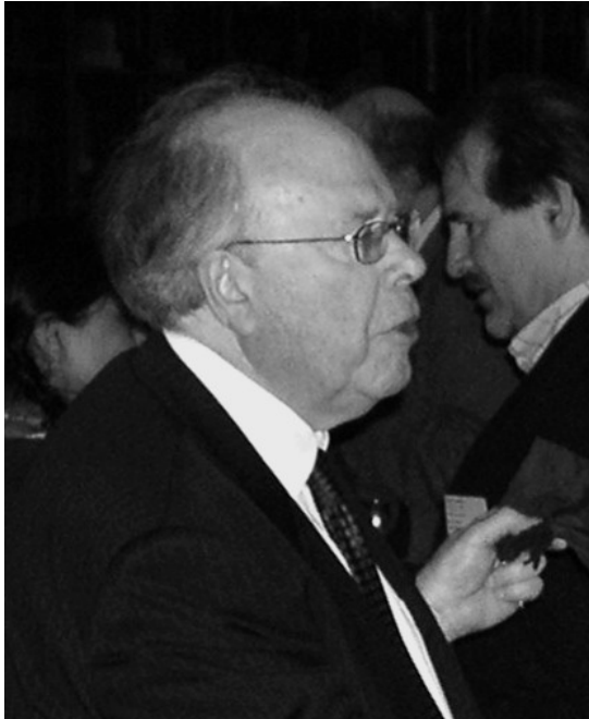
Figura 1. L'investigador Noel Gale, que impulsà i desenvolupà l'aplicació d'isòtops de plom a l'arqueologia des de la dècada dels anys setanta, continua actualment amb la investigació sobre la possible aplicació d'altres isòtops.

ció sistemàtica centrant-se principalment en els metalls de les cultures de la Mediterrània oriental i desenvolupant un ampli programa al llarg de diversos anys en col·laboració amb Sophia Stos-Gale, des de l' Isotrache Laboratory de la Universitat d'Oxford (GALE, 1978; GALE I STOS-GALE, 1981; 2002). A la dècada dels anys vuitanta els seus treballs van ser la principal referència per al posterior desenvolupament de la seva ocupació en la investigació arqueometal·lúrgica amb l'aparició d'altres laboratoris d'anàlisi, tant a Anglaterra i als EUA com en altres països d'Europa. Entre ells destaquen la Universitat de Bradford, l'Institut Max Planck de Heidelberg o la Smithsonian Institution . La generalització de laboratoris capaços d'abordar aquest tipus d'anàlisi ha permès la seva major aplicació i l'estudi en la metal·lúrgia d'altres regions del món. Als anys noranta i a principis del segle XXI una gran part dels treballs dedicats a la metal·lúrgia antiga ja inclouen anàlisi d'isòtops de plom.