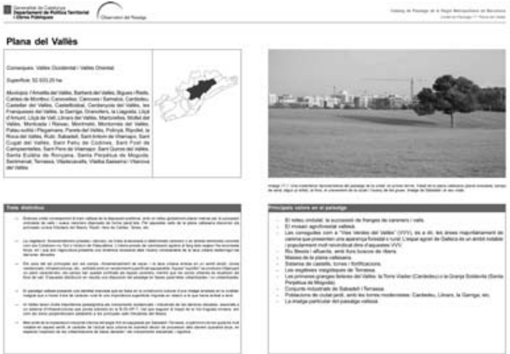
Imatge 6. En el marc del Catàleg corresponent, per a cadascuna de les unitats de paisatge, s’obté una fitxa. Aquesta imatge mostra el primer full de la que correspon a la Plana de Vallès.

Les unitats de paisatge són rellevants perquè constitueixen les peces territorials bàsiques on aplicar polítiques de paisatge concretes, tenint en compte cada caràcter. Tenen una extensió mitjana de 237 km 2 , adequada per ser integrades en els plans territorials parcials o els plans directors territorials. Alhora, disposar del mapa dels paisatges de Catalunya també és molt important perquè constitueix una eina pedagògica 9 molt poderosa perquè el jovent —i la societat en general— prengui consciència dels paisatges on viu, de la importància dels seus valors naturals, culturals, socials, productius, simbòlics o identitaris, així com de la seva singularitat i els riscos que duen associats.