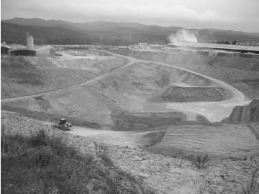
Imatge 18. Un dels indrets més coneguts de la Plana del Vallès que es troben en una situació degradada: l'extracció d'àrids, encara en funcionament, a la plana del Castell de Sant Marçal (Cerdanyola del Vallès), situada al bell mig de la via verda Sant Llorenç-Collserola.

A mitjà termini, la taca urbana arribarà a ser predominant a la plana vallesana, no només lleugerament per sobre del recobriment superficial dels espais agraris (com s'esdevé avui dia), sinó sobrepasant-los àmpliament. La previsió és, per tant, que els espais oberts es vagin reduint progressivament i la urbanització hi avanci. En definitiva, el paisatge identitari del Vallès, el dels espais oberts —principalment els de dominància agrària i rural—, no té unes perspectives gens falagüeres.