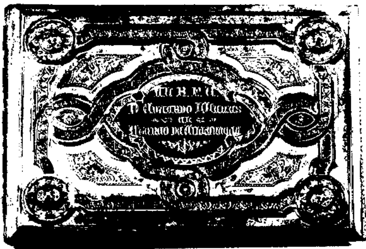
Portada de l'àlbum en homenatge al pare Llanas dipositat a la Biblioteca-Museu Balaguer.