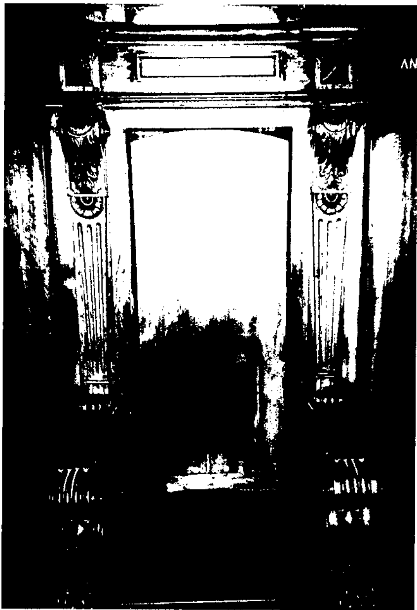
Cadira de la sala de juntes de la Biblioteca-museu Balaguer dedicada al pare Llanas.