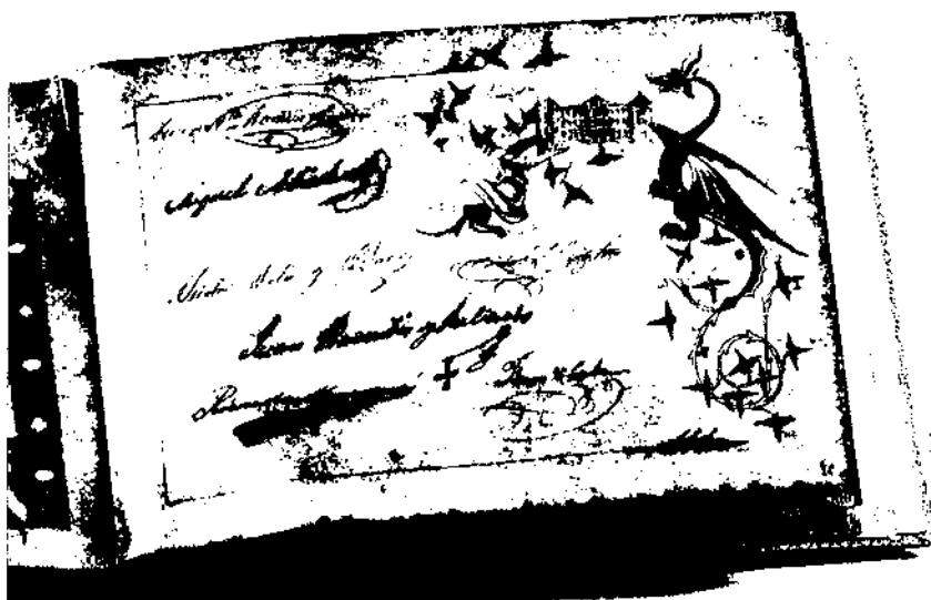
Full de l'àlbum en homenatge al pare Llanas on apareix la miniatura del Col·legi Samà de Vilanova i la Geltrú.