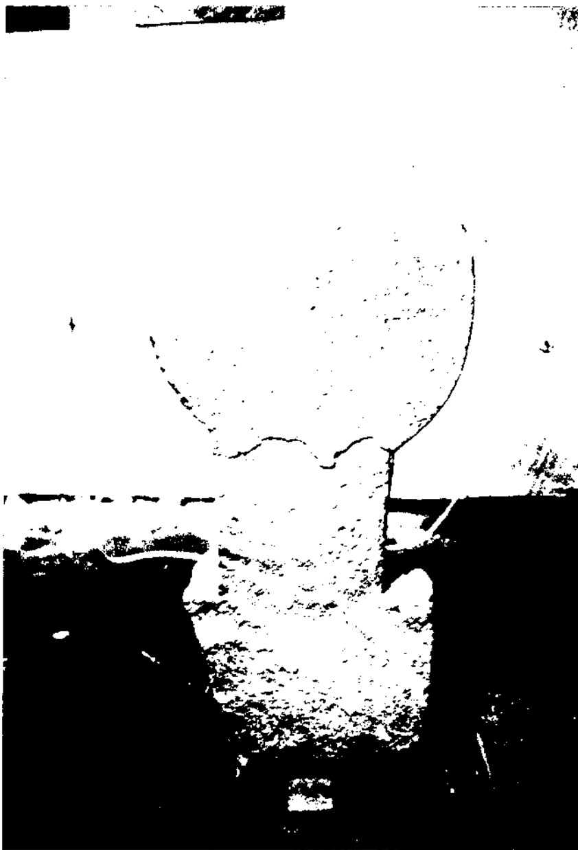
Figura 2: Revers de l'estela (autor P. Rius).