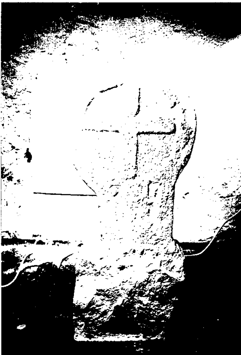
Figura 1: Anvers de l'estela (autor P. Rius).