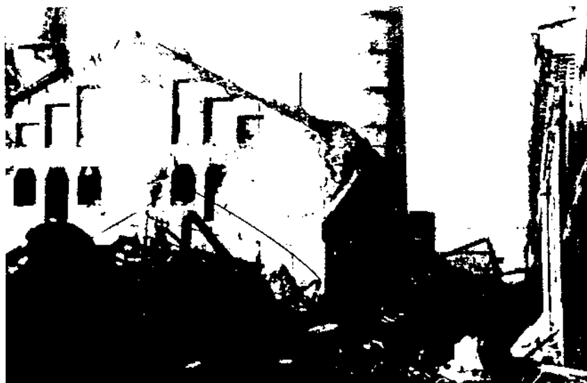
Aspecte de l'interior de la fàbrica Pirelli, el 1939.

Un tema present des dels primers moments és la reconstrucció de la fàbrica Pirelli, parcialment destruïda i molt malmesa els últims dies del " dominio rojo ". A la reunió municipal de l'11 de març de 1939 es reconeix que " la actividad de su industria ha constituido la base económica de esta población " i s'acorda oferir terrenys, entre la rambla Pirelli i el torrent de Sant Joan, per a reconstrucció i restitució de la fàbrica. (Abans totes les instal·lacions de la fàbrica eren entre la rambla de la Pau i la rambla Pirelli.) Més tard (12 maig), s'aprova un pressupost extraordinari de 500.000 pessetes per al pagament de terrenys i edificis cedits a Pirelli. L'interès de l'Ajuntament per al restabliment de l'empresa Pirelli i per evitar que sigui traslladada de Vilanova és reiterat en aquest període. Amb aquesta finalitat es recullen firmes i se celebra una manifestació. (12) Acordada l'esmentada inversió, són