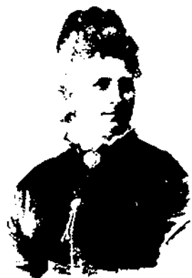
Josefina Giralt i Giralt (Barcelona 1840 - Barcelona 1908).