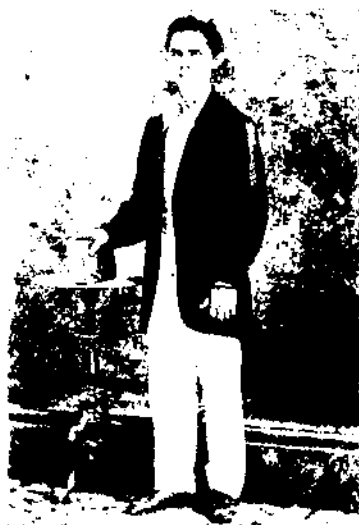
Octavi Giralt i Giralt (Sitges 1843 - Barcelona 1861).