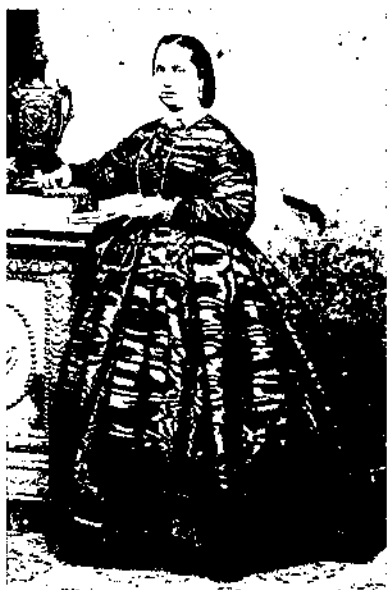
Emilia Giralt i Giralt (Sitges 1835 - Ribes 188?).