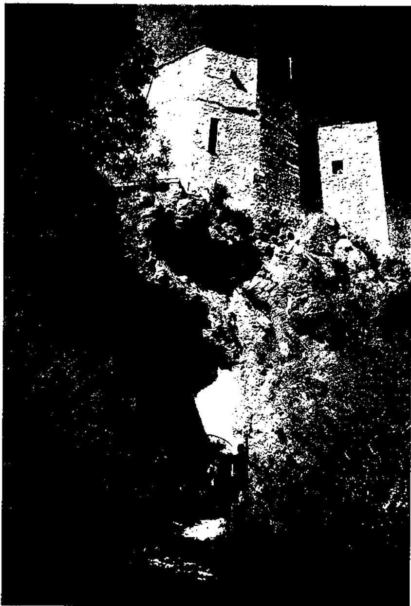
Cova de la Verge, a sota del castell. Torrelles de Foix.