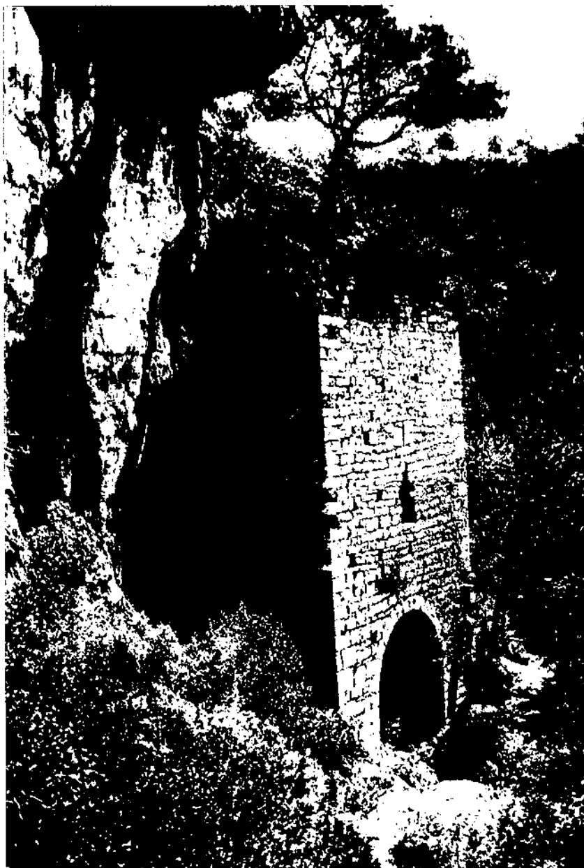
Sant Salvador de la Balma. Pontons.