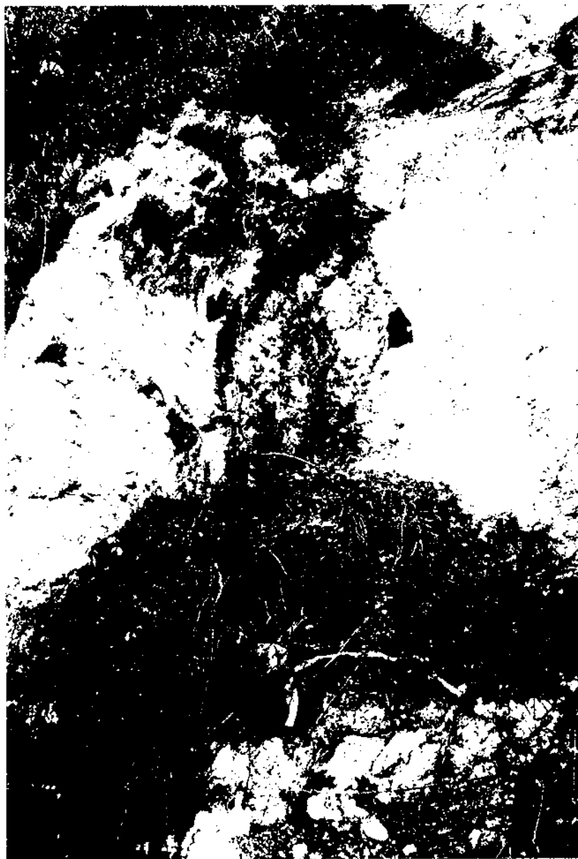
Sant Julià. Sant Pere de Riudebitlles.