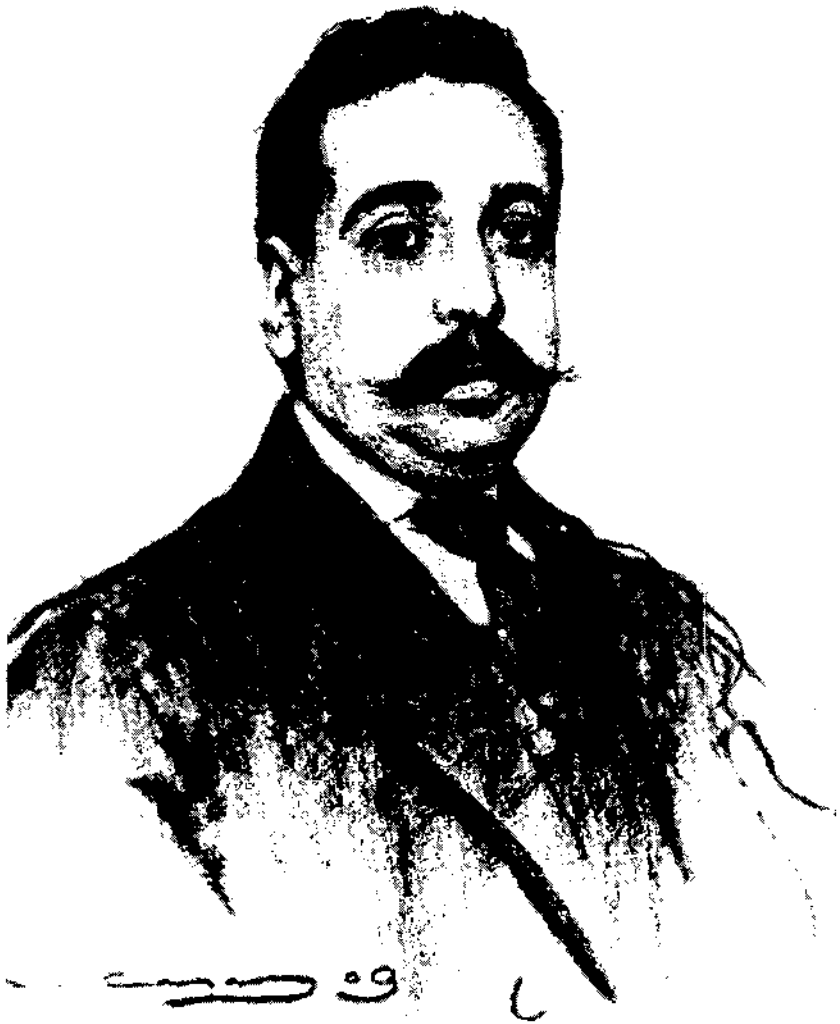
Amadeu Hurtado segons un retrat al carbó de Ramon Casas (1909).