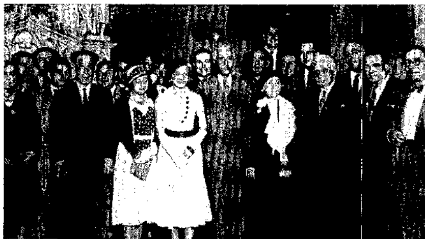
Amadeu Hurtado junt amb Francesc Macià i altres familiars i amics el 17 d'abril de 1931, amb motiu de la proclamació de la Generalitat de Catalunya. Podem veure, entre d'altres, Ventura Gassol i Josep Tarradellas.