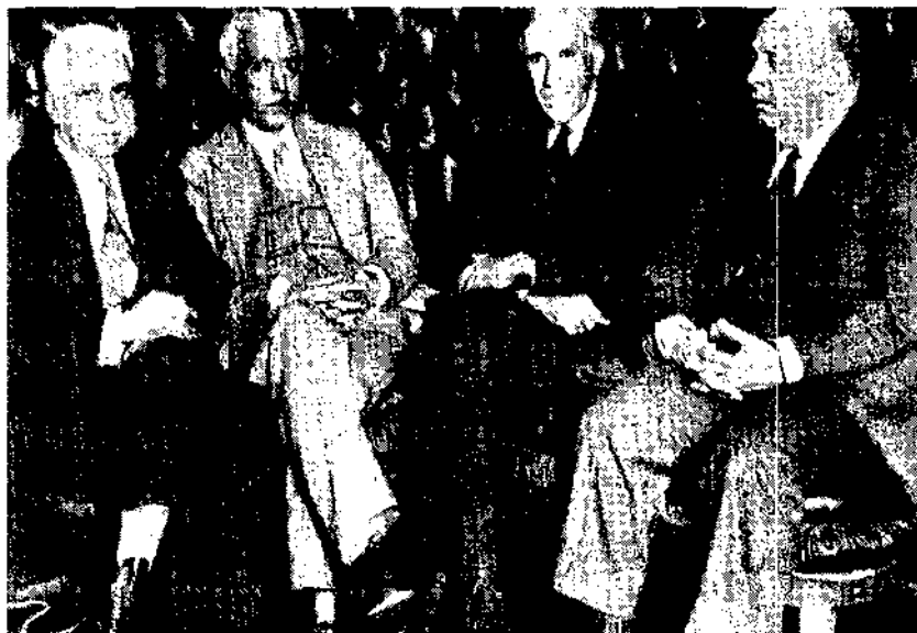
Amadeu Hurtado amb Francesc Macià, Julián Besteiro, president de les Corts Constituents, i Indalecio Prieto, ministre del Govern de la República.