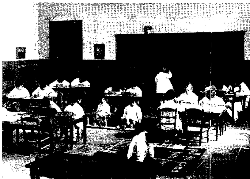
Fotografia en la qual es recull un moment d'una classe de l'Escola Montessori. La nena escriu en català a la pissarra: «els mesos de l'any...».

«L'educació del tacte». (10) «L'educació del sentit visual». (11) «L'educació visual combinada amb l'educació tàctilo-muscular». (12) El contingut d'aquests articles és molt interessant, però el més valuós, precisament, és la seva part didàctica ja que, mitjançant la premsa, les persones de Vilanova podien conèixer el que representava aquest mètode i prenen coneixement que el nen quan jugava no solament es divertia sinó que també s'anava desenvolupant.