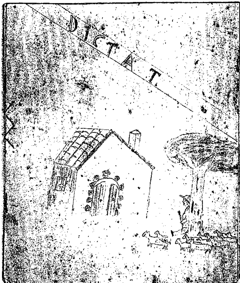
Portada de la llibreta de dictat propietat de J. Dallà, datada de l'any 1930.