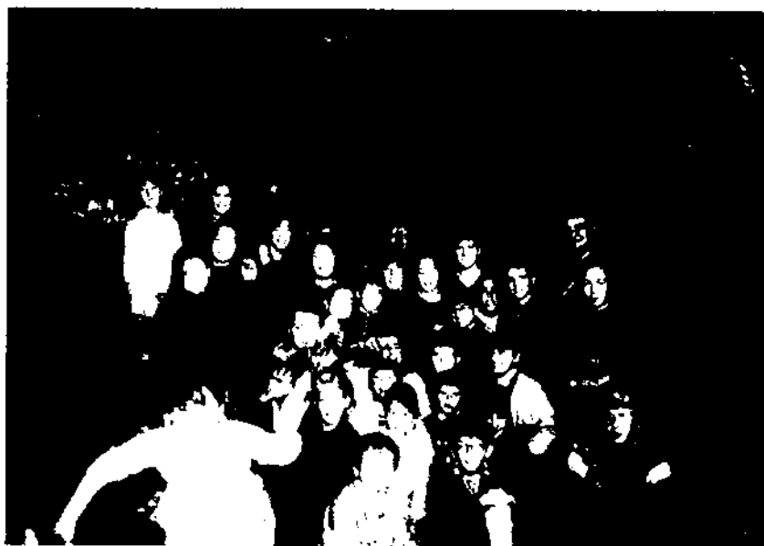
Grup d'alumnes de 6è d'EGB de l'Escola Pública Les Cometes de Llorenç del Penedès, curs 1991-92, a l'entrada de la cova de Vallmajor a Albinyana.