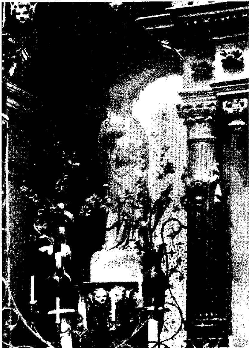
El Retable de Santa Anna, obra en la qual prengueren part els dos Massalvà, en dues etapes de construcció. Fotografia de n'Isidre Güixens del 1928. Col·lecció de l'autor.