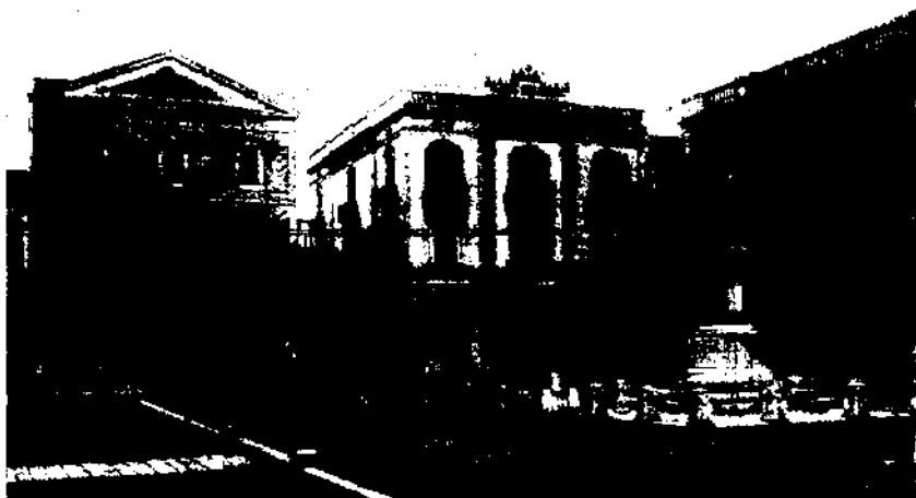
Plaça de la Constitució de Vilanova i la Geltrú (avui plaça de la Vila). A l'esquerra de la fotografia, l'edifici on del 1864 al 1874 es va instal·lar el Col·legi Lliure de Segon Ensenyament.

En la Sessió Ordinària del 8 de juliol e 1865 entra a l'Ajuntament una comissió representant de gran nombre de pares de família que per unanimitat demanen l' ensenyament gratuït donat pels escolapis . (25)