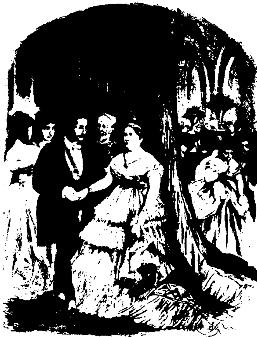
La Reina Isabel II amb el ministre d'Ultramar Carlos Marfori, amb el qual va mantenir unes estretes relacions (gravat publicat a l'obra Isabel II. Reina de España de Pedro de Répide.