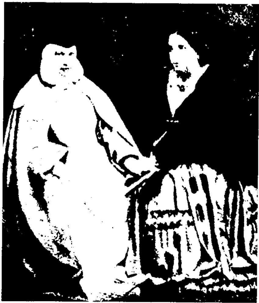
Isabel II i Sor Patrocinio. La fotografia representa la reina en els seus darrers temps, dominada, segons sembla, per la influència pseudomística d'aquesta monja (fotografia publicada a Blanco y Negro el 14 de maig de 1904).