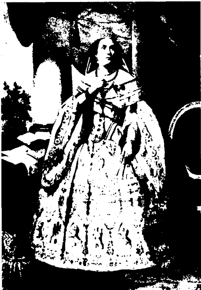
La Reina Isabel II segons un gravat publicat a l'obra Isabel II. Reina de España de Pedro de Répide.