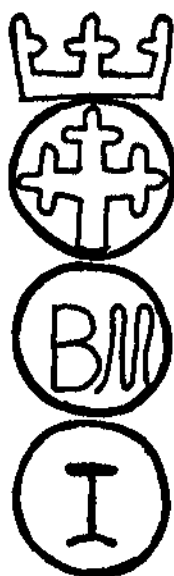
Filigrana de tipus heràldic de tres nivells superposats corresponent a la primera meitat del segle XVII. Es troba als folis 146 al 163 del còdex sense numerar del setè capítol, i al primer, segon i darrer còdex del vuitè capítol.