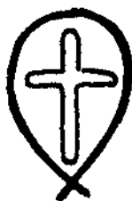
Marca d'aigua de finals del segle XVI. Es troba al paper utilitzat en el cinquè còdex del foli 237 al 260.