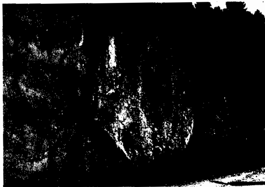
Estat actual del possible forn del Puig Casteller