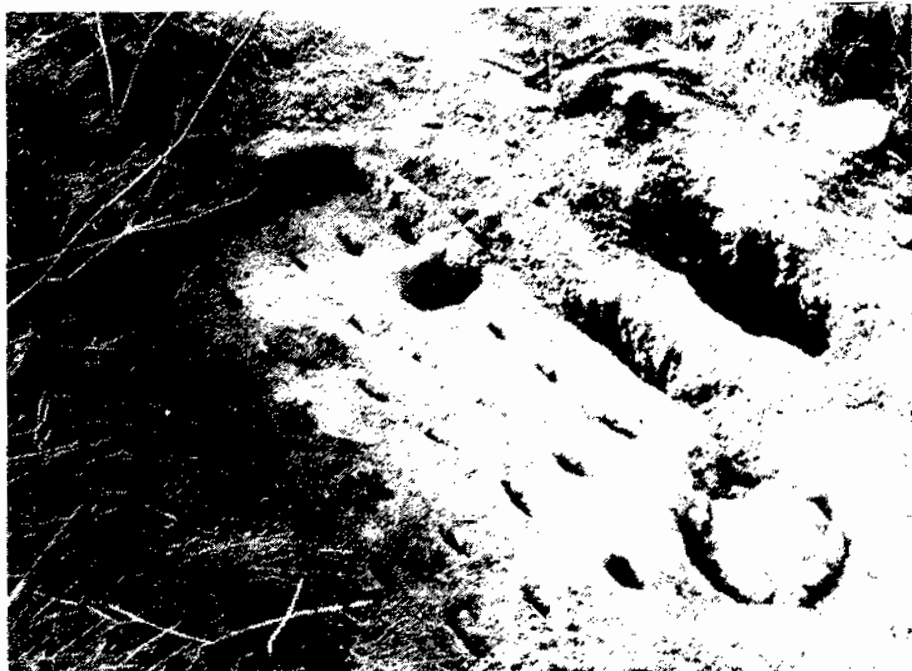
Engraellat del forn de les Badies