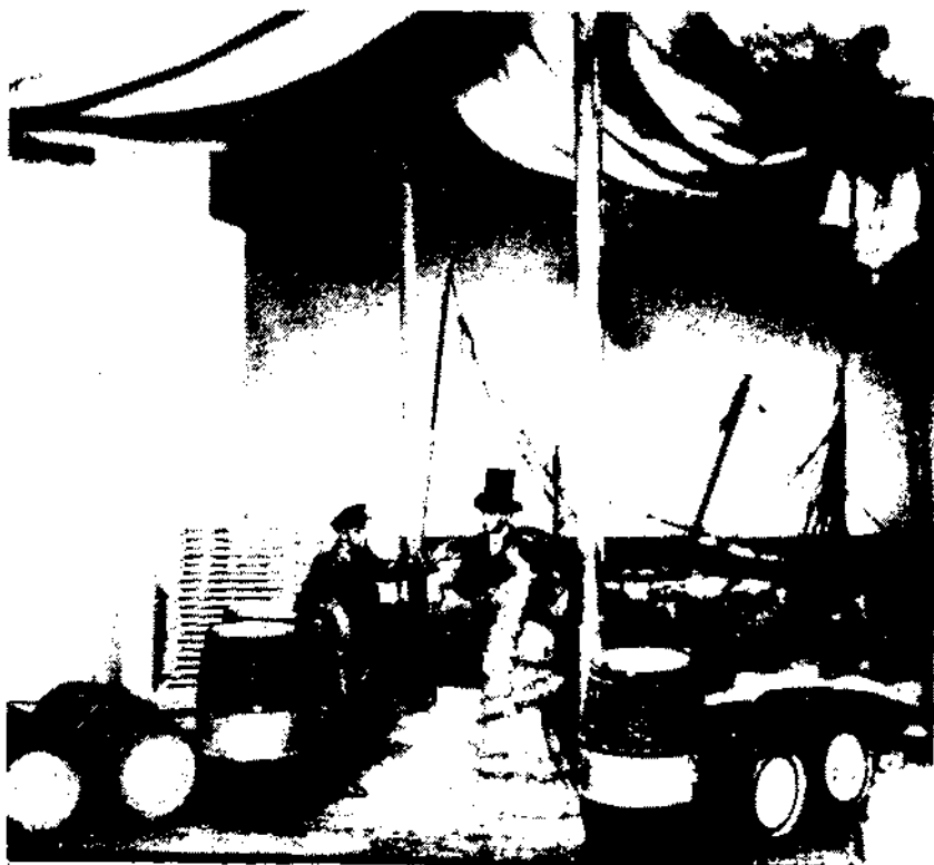
Embarcament de vins a ultramar, segle XIX - Diorama del Museu del Vi

Emili Giralt i Raventós, de Vilafranca del Penedès, analitzà les dades del primer cadastre, el de l'any 1717, publicant-los l'any 1950 en " Actas y Comunicaciones de la 1.ª Asamblea Intercomarcal de Investigadores del Penedès i Conca d'Odena " pp. 166-176.