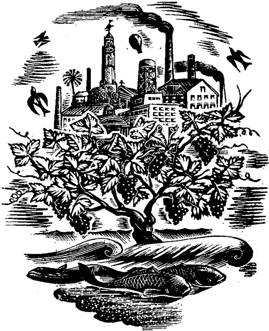
Reproducció d'un gravat al box d'Enric C. Ricart.