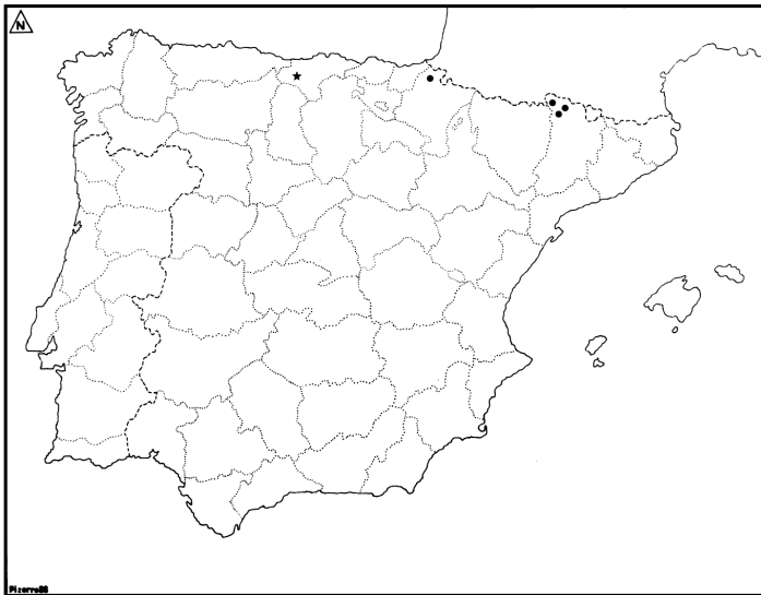
Figura 3. Mapa de distribución de Bazzania tricrenata (Wahl.) Lindb. en la Península Ibérica. Distribution map of Bazzania tricrenata (Wahl.) Lindb. in the Iberian Peninsula.