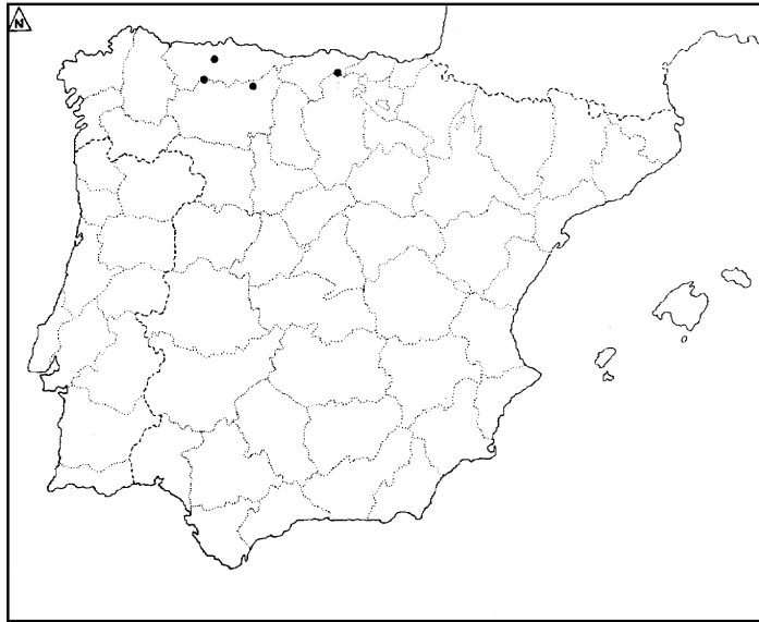
Figura 2. Mapa de distribución de Sphagnum brevifolium Flatb. en la Península Ibérica. Distribution map of Sphagnum brevifolium Flatb. in the Iberian Peninsula.