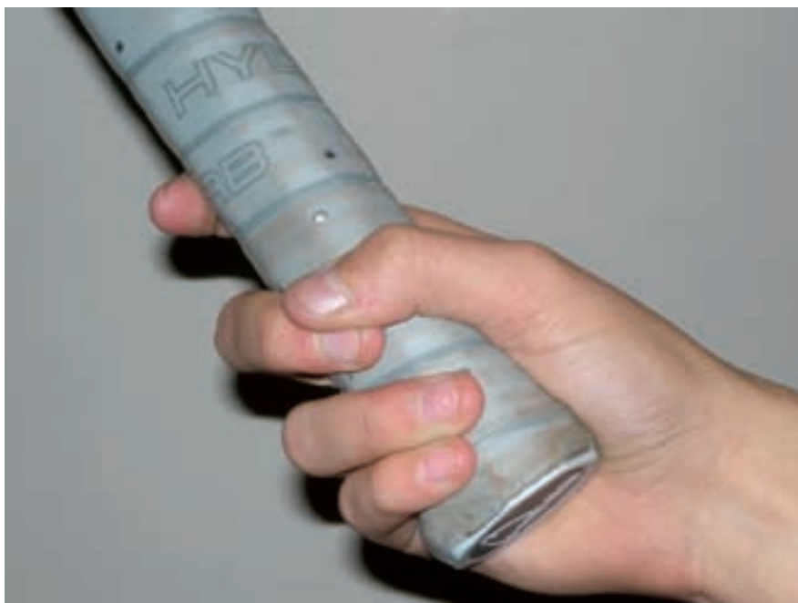
Figura 1 Imatge de com s'agafa la raqueta de tennis (grip).