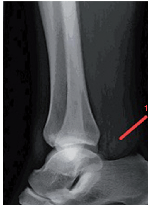
Figura 1 Radiografia lateral del turmell, obliteració del triangle de Kager del múscul soli accessori.

Malgrat que pot ser una troballa fortuïta durant una ressonància realitzada per una lesió no relacionada 3,8 , la presentació típica és una massa tova al terç distal posteromedial de la cama, que augmenta de grandària amb l'activitat física, especialment amb la flexió plantar 4-5,8 . S'acompanya de dolor en el 67% de casos 3 , que empitjora amb les curses i els salts 4,8,10 . Aquests símptomes podrien explicar-se per la