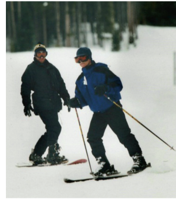
Figura 2 Vail, Colorado, 2012.

Excel·lent metge, avesat científic, magistral professor i per sobre de tot una gran persona, savi, ben disposat, sempre amb un somriure, actiu i ple d'energia vital: practicava el que predicava. Era un predicador nat, sobretot amb l'exemple. que va treballar fins el darrer moment, i creiem que gairebé va complir el que sempre deia, que volia marxar sa i actiu.