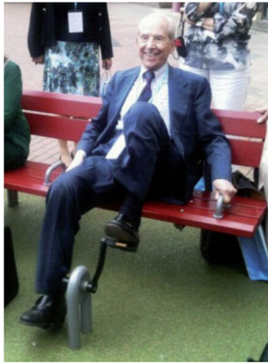
Figura 1 Barcelona, 2012.