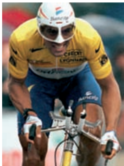
Figura 19 Miguel Indurain.