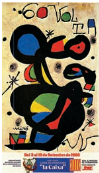
Figura 14 Cartell de la 60a Volta, 1980. Autor: J. Miró.