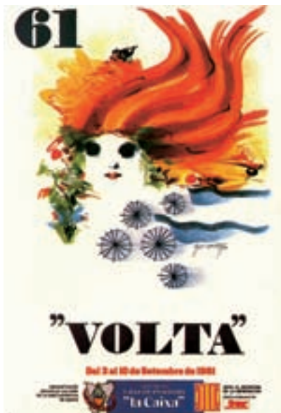
Figura 15 Cartell de la 61a Volta, 1981. Autor: M. Cuixart.