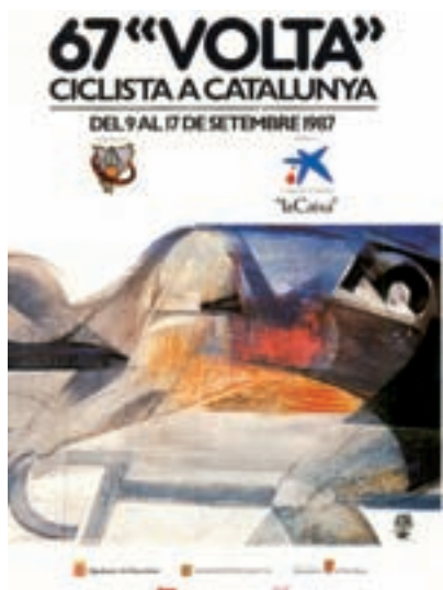
Figura 20 Cartell de la 67a Volta, 1987.

Martín Perdiguero (84a) i David Cañada (86a). Van participar en la Volta reconeguts ciclistes estrangers, com Rominguer, Bugno, Bruynel, Alvaro Mejía (guanyador de la Volta 73a), Claudio Ciapucci (74a), Laurent Jalabert (75a), Alex Zulle (76a), Hernán Buenahora (78a), Yaroslav Popovych (85a) i Vladimir Karpets (87a). El 2005 la Volta ad-