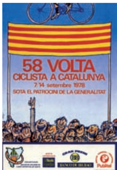
Figura 13 Cartell de la 58a Volta, 1978. Autor: Cesc.