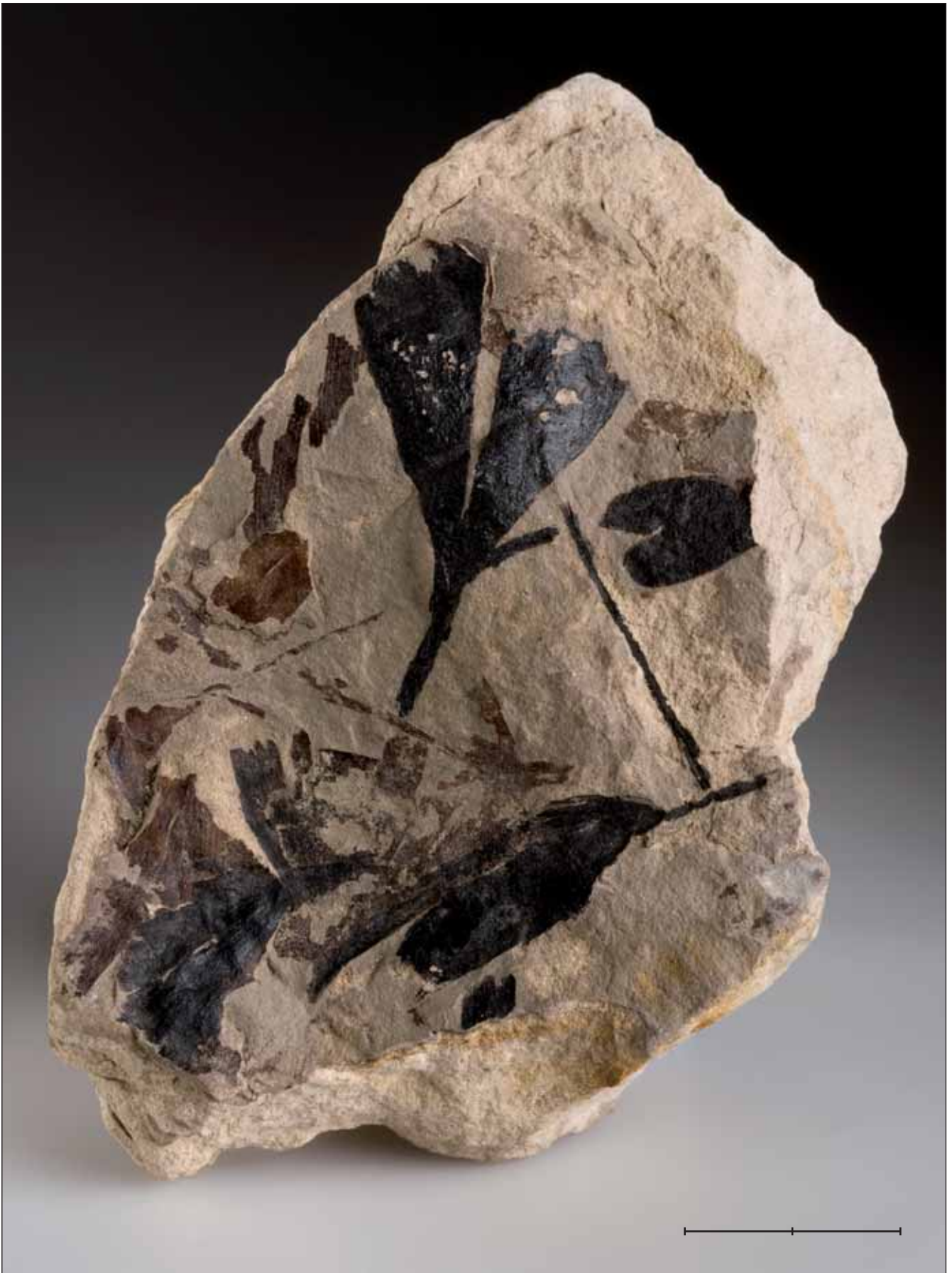
Fig. 19. Fulles de Ginkgo huttoni (Stenberg, 1833) Heer, 1876, un representant del Juràssic mitjà dels ginkgos actuals procedent del jaciment clàssic de Scarborough (Yorkshire, Anglaterra, Regne Unit). Exemplar MGB 42525. Escala, 2 cm.

Fig. 19. Leaves of Ginkgo huttoni (Stenberg, 1833) Heer, 1876, a Middle Jurassic representative of the modern-day ginkgos, from the classic site of Scarborough (Yorkshire, England, United Kingdom). Specimen MGB 42525. Scale bar, 2 cm.