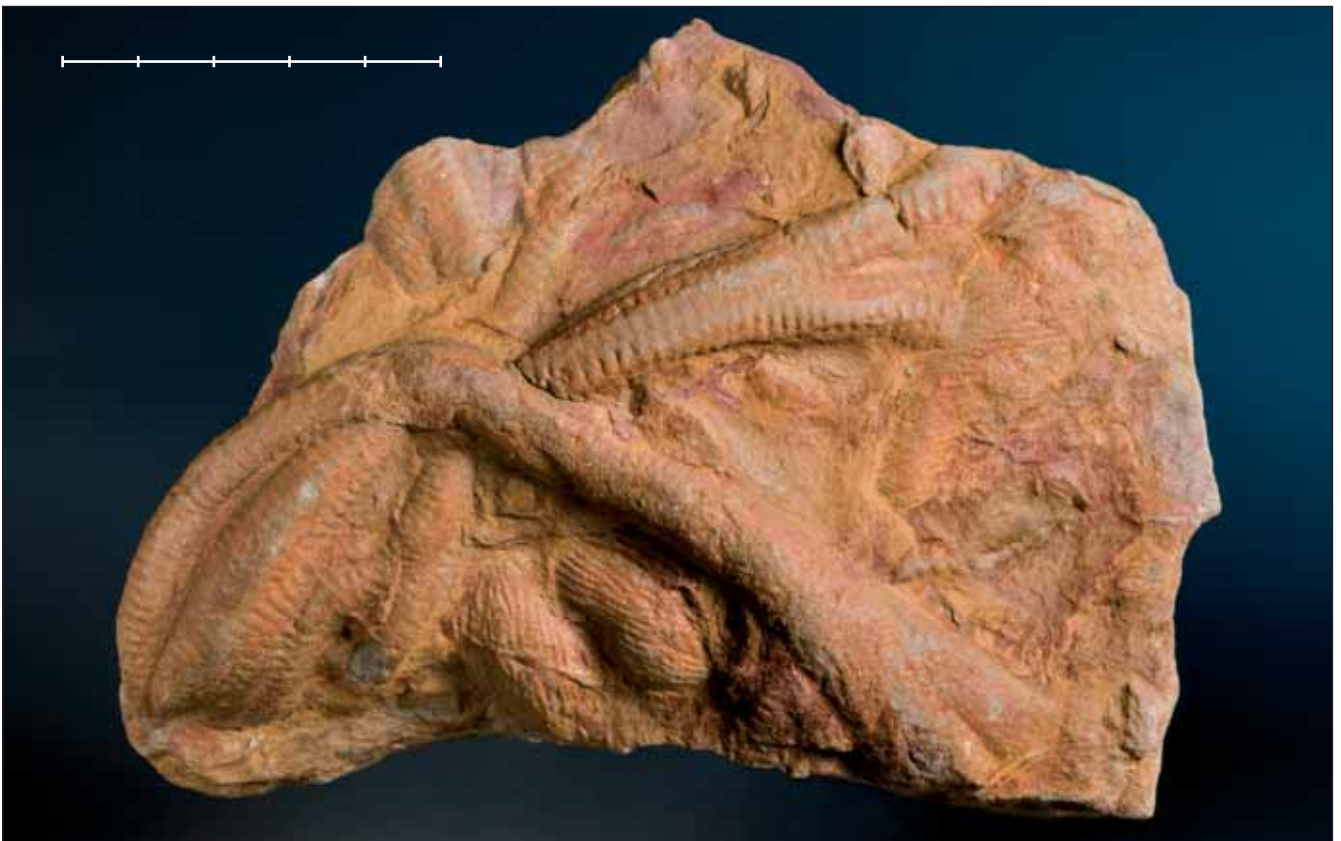
Fig. 21. Bilobites sp. (MGB 42397 probablement Cruziana ), icnofòssil de l'Ordovicià de Las Navas (Baterno, Badajoz). Aquest jaciment fou descobert pel Dr. Gómez-Alba en el decurs dels seus estudis com a geòleg a la Universidad Complutense de Madrid. Escala, 5 cm.

Fig. 20. Leaf of Persea princeps (Heer, 1856) Schimper, 1870 from the Pontian (Miocene) of Prats (Prats i Sansor, Girona province, NE Spain). Specimen MGB 42782 figured in Barrón (1995, pl. 9, fig. 1). Scale bar, 4 cm.