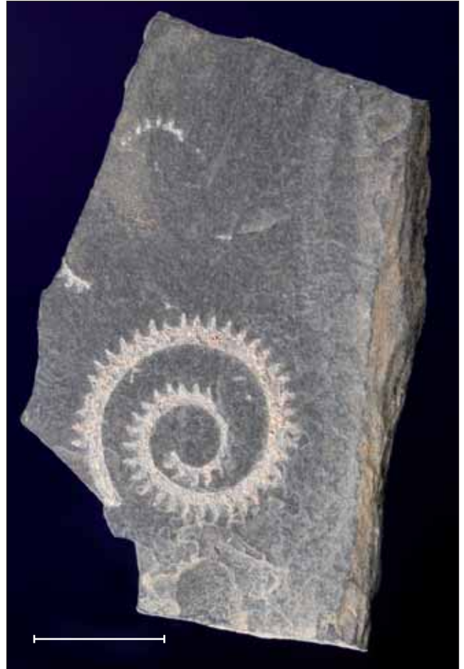
Fig. 13. Spirograptus spiralis (Geinitz, 1842), un graptòlit característic del Llandoverià superior (Silurià) de Checa (Guadalajara). Exemplar MGB 42322 figurat a Gómez-Alba (1988, làm. 324, fig. 8). Escala, 1 cm. Foto J. Vidal Fugardo.

Província de Córdoba, Espanya Neogen, Miocè MGB 42345 (Gómez-Alba, 1988, Làm. 335, Fig. 13) cinctus (Agassiz, 1843), Sparus Sant Pere de Ribes, Garraf, Barcelona, Catalunya Neogen, Miocè MGB 42346 crassicaudus (Agassiz, 1839), Aphanius Cherasco, Cuneo, Piemont, Itàlia Neogen, Miocè MGB 42350 jomnitanus Valenciennes, 1844, Sargus Província de Córdoba, Espanya Neogen, Miocè MGB 42347 (Gómez-Alba, 1988, Làm. 335, Fig. 14), MGB 42348 sp., Lepidotus França Juràssic superior MGB 42343 Indeterminat MGB 42819