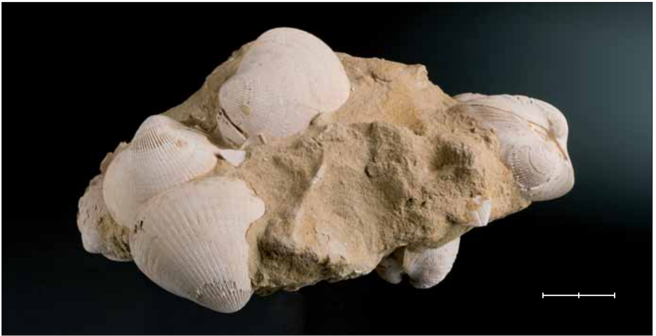
Fig. 4. Grup d'exemplars (MGB 40355) de Glycymeris insubrica (Brocchi, 1814) del Pliocè de Bonares (Huelva). Escala, 2 cm. Fig. 4. Group of Glycymeris insubrica (Brocchi, 1814) specimens (MGB 40355) from the Pliocene of Bonares (Huelva province, SW Spain). Scale bar, 2 cm.