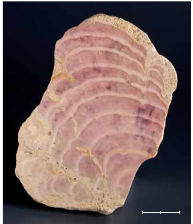
Fig. 16. Secció polida de Solenopora jurassica Brown, 1894, rodofícia del Juràssic mitjà de Gloucester (Gloucestershire, Anglaterra, Regne Unit). Són evidents les diferents fases de creixement i les restes de la coloració original. Exemplar MGB 42526 figurat a Gómez-Alba (1988, làm. 1, fig. 1). Escala, 2 cm.

Fig. 15. Tooth (MGB 42360) of Desmostylus hesperus Marsh, 1888, a sea mammal living during the Miocene in California (United States of America). Scale bar, 1 cm.