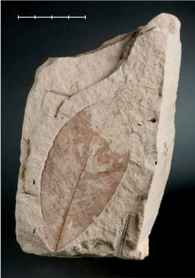
Fig. 20. Fulla de Persea princeps (Heer, 1856) Schimper, 1870 del Pontianà (Miocè) de Prats (Prats i Sansor, La Cerdanya, Girona). Exemplar MGB 42782 figurat a Barrón (1995, làm. 9, fig. 1). Escala, 4 cm.

Fig. 20. Leaf of Persea princeps (Heer, 1856) Schimper, 1870 from the Pontian (Miocene) of Prats (Prats i Sansor, Girona province, NE Spain). Specimen MGB 42782 figured in Barrón (1995, pl. 9, fig. 1). Scale bar, 4 cm.