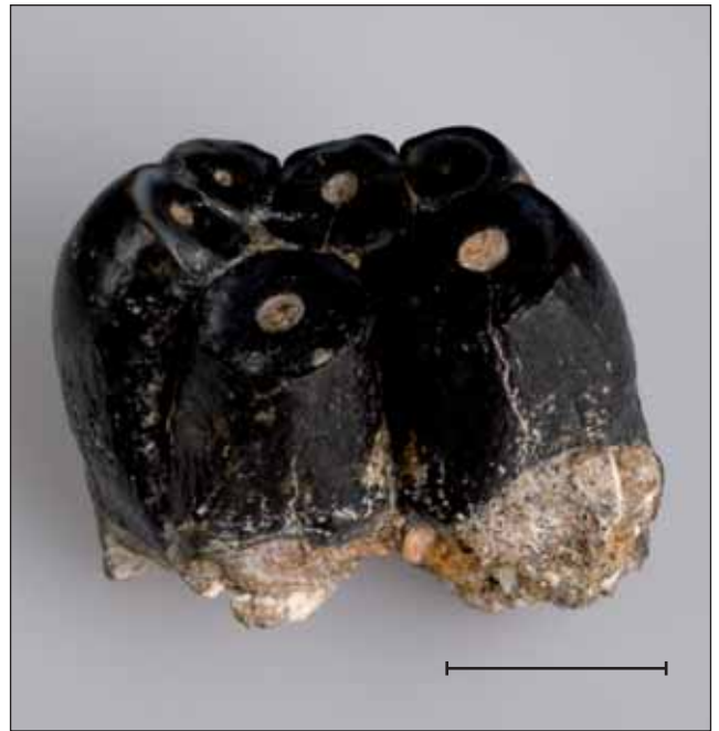
Fig. 15. Molar (MGB 42360) de Desmostylus hesperus Marsh, 1888, un mamífer marí que va viure durant el Miocè a Califòrnia (Estats Units de Nordamèrica). Escala, 1 cm.

feminaeformis (Schlotheim, 1820) Barthel, 1968, Nemejcopteris