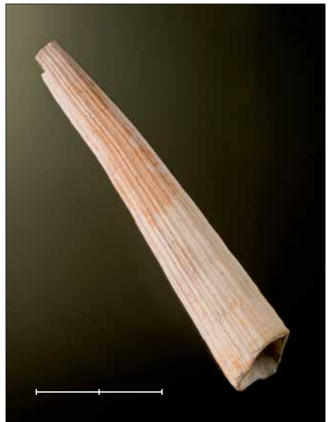
Fig. 3. Dentalium (Fissidentalium) rectum Gmelin, 1791, escafòpode del Pliocè de Perpinyà (Pirineus-Oriental, França) (MGB 40244). Escala, 2 cm.

Bonares, El Condado, Huelva, Espanya Neogen, Pliocè