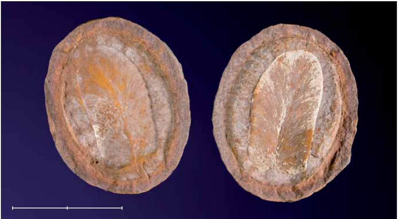
Fig. 18. Motlle i contramotlle d'una pinnula de falguera indeterminada del Carbonífer inferior (MGB 42786). Molt probablement procedeix del grup de jaciments excepcionals de Mazon Creek (Morris, Grundy County, Illinois, Estats Units de Nordamèrica). Escala, 2 cm. Fig. 18. Positive (right) and negative (left) casts of an undetermined fern very probably coming from the Lower Carboniferous (MGB 42786) exceptional sites around Mazon Creek (Morris, Grundy County, Illinois, United States of America). Scale bar, 2 cm.