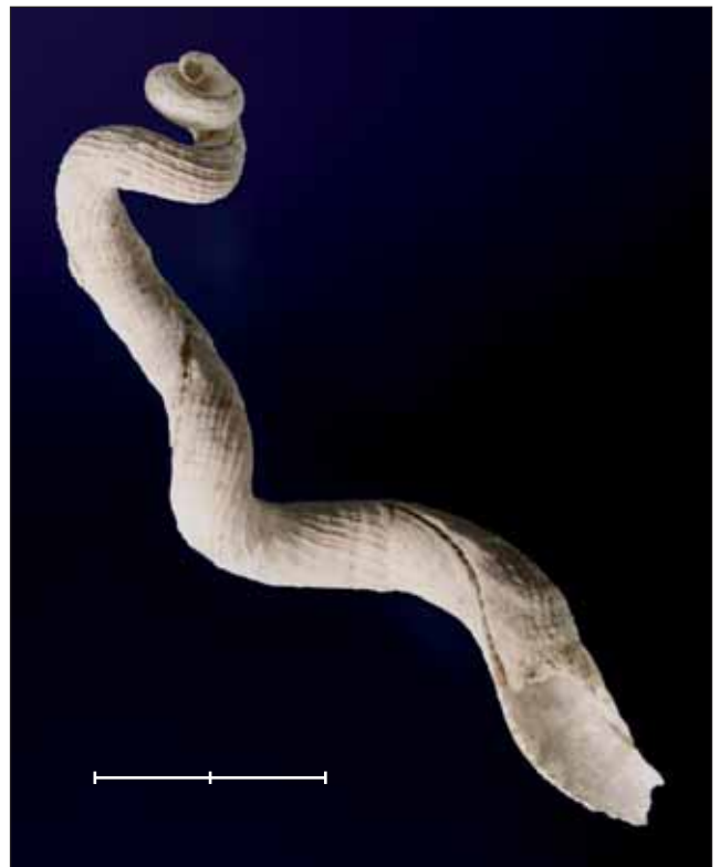
Fig. 7. Tenagodus striatus (Defrance, 1827), gasteròpode del Lutecià (Eocè) de Chaussy (Val-d'Oise, França). Exemplar MGB 41222 figurat a Gómez-Alba (1988, làm. 143, fig. 5). Escala, 2 cm. Fig. 7. Tenagodus striatus (Defrance, 1827), a gastropod from the Lutetian (Eocene) of Chaussy (Val-d'Oise, France). Specimen MGB 41222 figured in Gómez-Alba (1988, pl. 143, fig. 5). Scale bar, 2 cm.