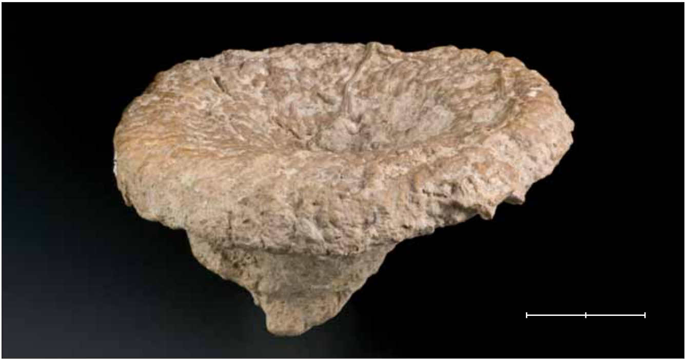
Fig. 1. Tremadictyon reticulatum (Goldfuss, 1826), esponja procedent del Juràssic superior de Frías de Albarracín (Terol). Exemplar MGB 39805 figurat a Gómez-Alba (1988, lám. 23, fig. 2). Escala, 2 cm.