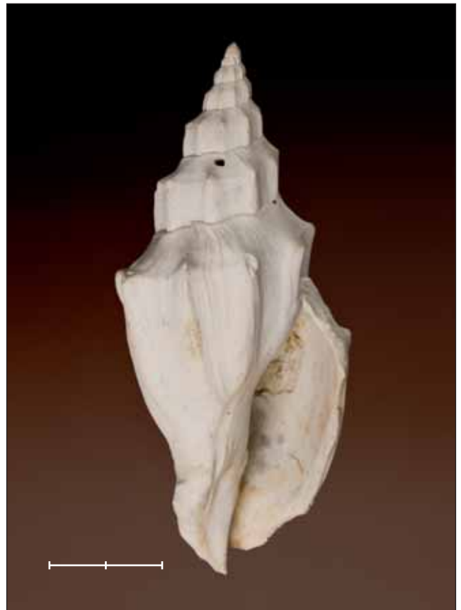
Fig. 6. Volutilithes muricinus (Lamarck, 1803) del Lutecià (Eocè) de Chaussy (Val-d'Oise, França). Exemplar MGB 41688 figurat a Gómez-Alba (1988, làm. 164, fig. 7). Escala, 2 cm. Fig. 6. Volutilithes muricinus (Lamarck, 1803) from the Lutetian (Eocene) of Chaussy (Val-d'Oise, France). Specimen MGB 41688 figured in Gómez-Alba (1988, pl. 164, fig. 7). Scale bar, 2 cm.