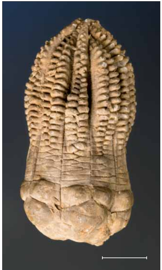
Fig. 11. Calze d' Encrinus liliiformis Lamarck, 1801, crinoideu de la facies Muschelkalk (Triàsic mitjà) d'Alemanya (MGB 42186). Escala, 1 cm.

Fig. 11. Calyx of an Encrinus liliiformis Lamarck, crinoid from the Muschelkalk (Middle Triassic) facies of (MGB 42186). Scale bar, 1 cm.