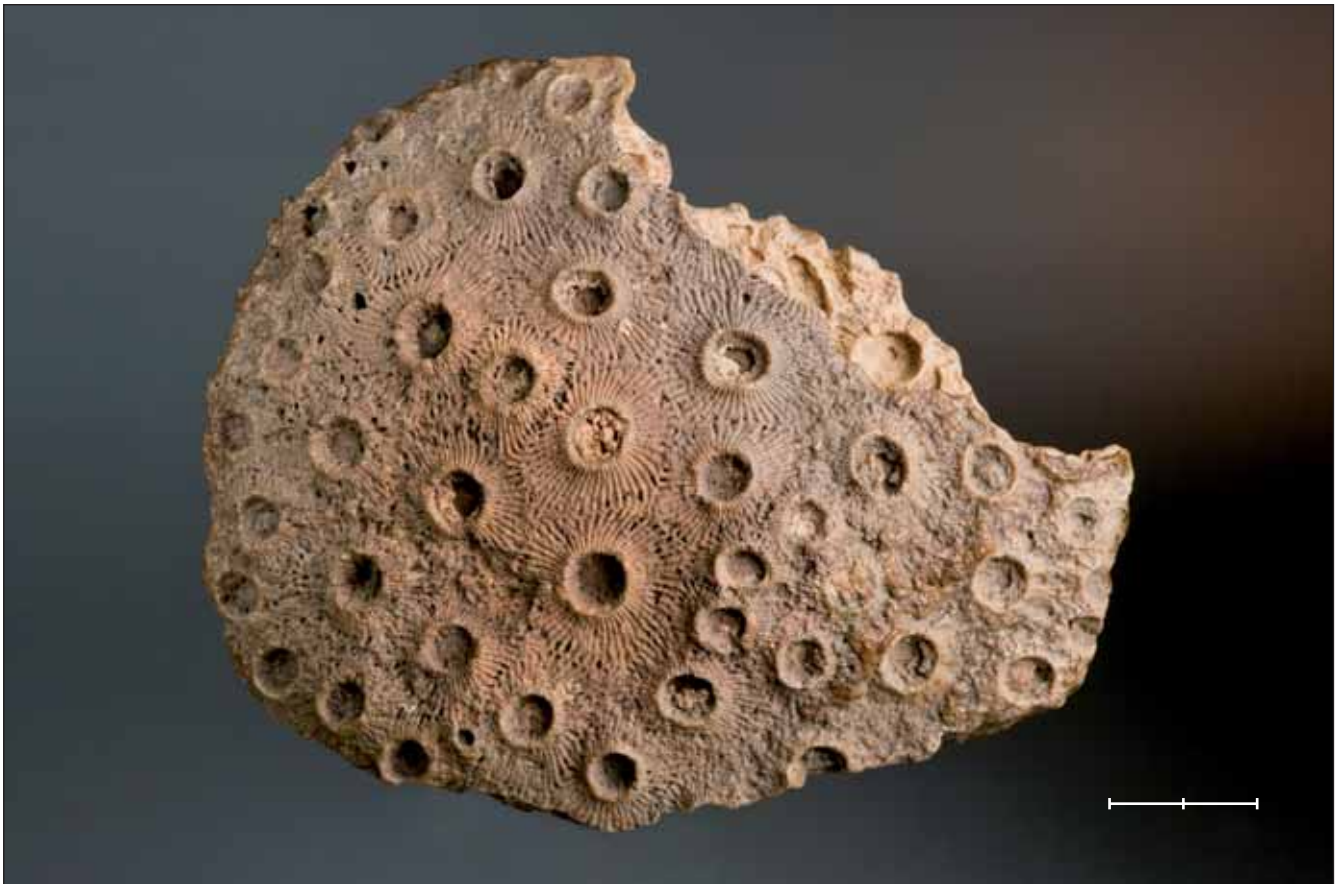
Fig. 2. Corall colonial indeterminat (MGB 39922) del Devonian-Carbonífer inferior de la regió de Timimoun (Adrar, Algèria). Escala, 2 cm. Fig. 2. Undetermined colonial coral (MGB 39922) from the Devonian-Lower Carboniferous of the Timimoun region (Adrar, Algeria). Scale bar, 2 cm.