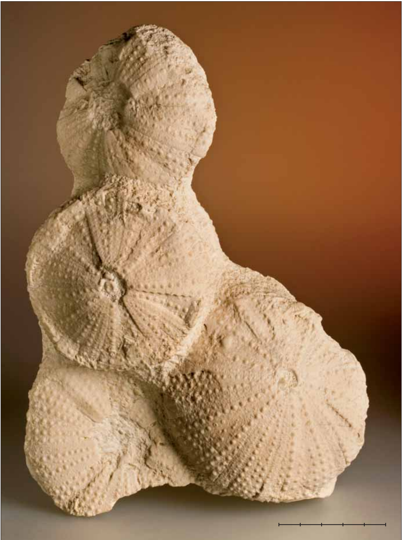
Fig. 12. Grup MGB 42248 de Tripneustes parkinsoni Agassiz, 1847 del Burdigalià (Miocè) de Lacoste (Vaucluse, França). Escala, 5 cm. Fig. 12. Group MGB 42248 of Tripneustes parkinsoni Agassiz, 1847 from the Burdigalian (Miocene) of Lacoste (Vaucluse, France). Scale bar, 5 cm.