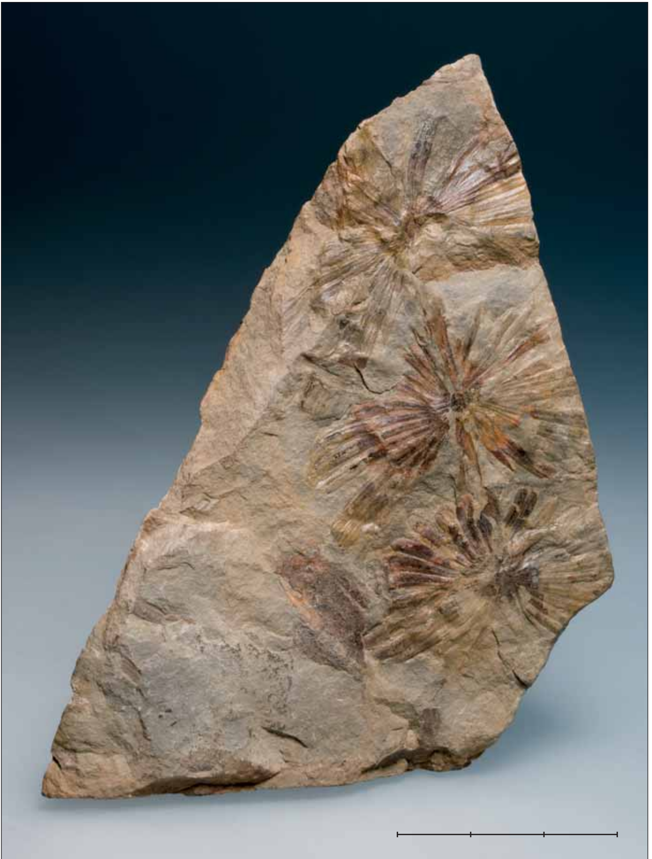
Fig. 17. Fragment d'una Annularia stellata (Schlotheim, 1820) Wood, 1860, equisetel de l'Estefanià (Carbonífer, Pennsilvània superior) de Soto y Amío (Villablino, Lleó). Exemplar MGB 42475 figurat a Gómez-Alba (1988, lám. 3, fig. 6). Escala, 3 cm. Foto J. Vidal Fugardo. Fig. 17. Fragment of the horsetail Annularia stellata (Schlotheim, 1820) Wood, 1860, from the Stephanian (Carboniferous, Upper Pennsylvanian) of Soto y Amío (Villablino, León province, NW Spain). Specimen MGB 42475 figured in Gómez-Alba (1988, pl. 3, fig. 6). Scale bar, 3 cm. Photo J. Vidal Fugardo.