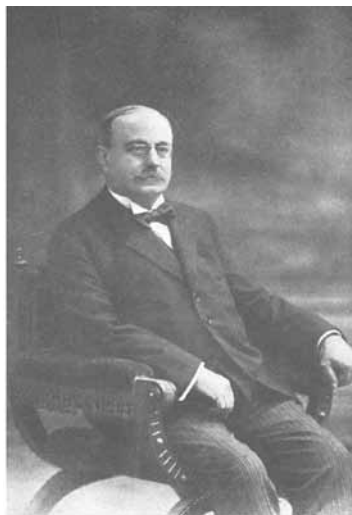
Fig. 2. Artur Bofill i Poch, impulsor de l'escola catalana de malacologia.

Fig. 2. Artur Bofill i Poch, promotor of the Catalan school of malacology.